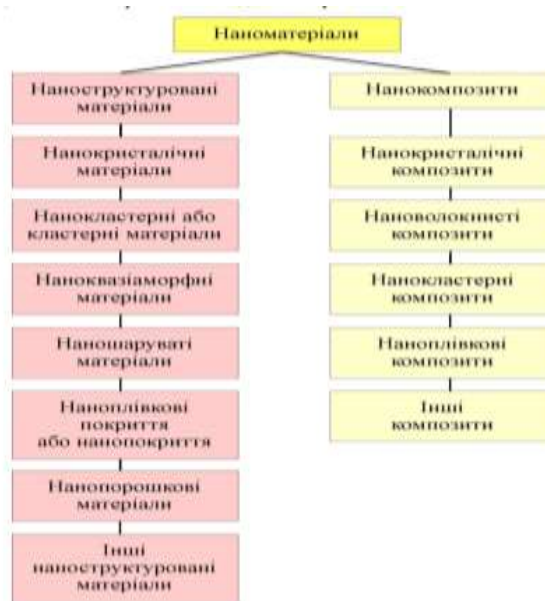
Рис.1. Класифікація наноматеріалів [10]