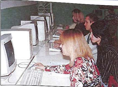
Понад 40 тис. чоловік зареєструвалося на пробне тестування

Ще у вересні Міністерство освіти і науки оприлюднило свої Умови прийому. На підставі цього документа вузи мали до 1 листопада цього року розробити власні Правила прийому і у триденний строк надіслати їх до Міністерства освіти і науки. Це потрібно насамперед для того, щоб учасники пробного незалежного тестування, яке почалося 1 листопада і тривало до 1 грудня, знали, які саме предмети у тому чи іншому вузі будуть конкурсними і які потрібні будуть сертифікати Українського центру оцінювання якості освіти. Правила прийому до КНУБА були надіслані до МОН і виставлені на сайті університету вчасно.