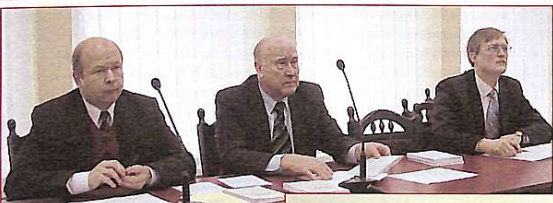
Президія студентської наукової конференції