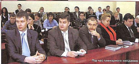
Під час пленарного засідання

матер, насамперед говорять, що дуже пишуться тим, що закінчили КНУБА, стали успішними науковцями, відомими фахівцями своєї справи, їх, як і наш вуз, знають закордоном, запрошують туди на роботу...Отже, успіхів вам, молода еліта!