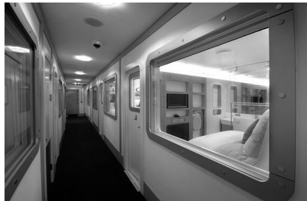
Рис. 5. Готель Yotel, аеропорт м. Хітроу

Бокси такого розміру розміщують окремо або групами в різних зонах терміналу (рис. 2, рис. 3). Компанія з Yotel додала до мінімуму пропонуємих послуг телевізор, wi-fi і душову кабінку в стандартній комплектації, а в преміум-кабінці – двоспальне ліжко. Площа встановлених в Хітроу, Гетвік (Лондон) і Схіпхол (Амстердам) боксів Yotel коливається від 10 до 15 кв. м. (рис. 5). По суті, це готель, що відрізняється від звичайного тільки своїми розмірами і портативністю.