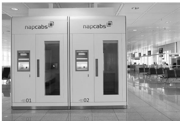
Рис. 4. Бокси Narcabs – Ментал, аеропорт м. Мюнхена