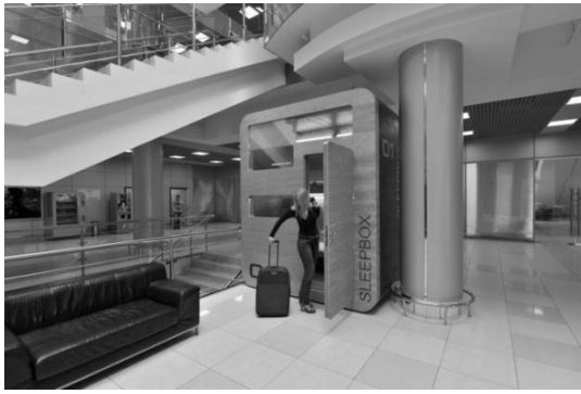
Рис. 2. Sleepbox, Росія, аеропорт Шереметьєво м. Москва