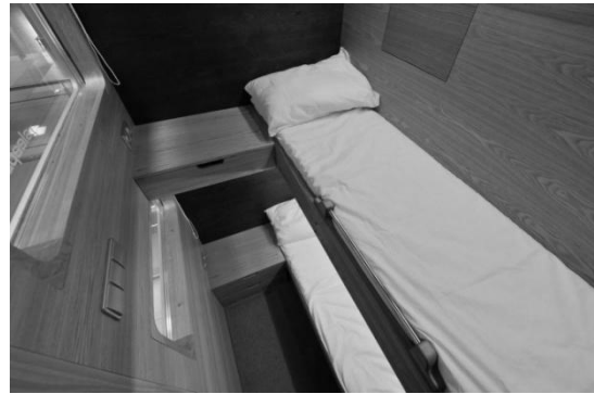
Рис. 3. Sleepbox – інтер'єрний простір