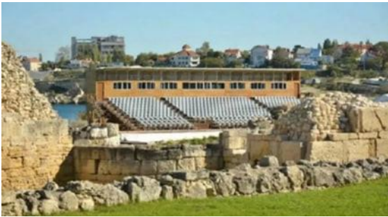
Рис. 2. Сучасний театр на залишках унікальної римської цитаделі [7]

міжнародними нормами, будувати без погодження ЮНЕСКО на цій території заборонено [5,6]. Росіяни повністю проігнорували міжнародні норми й розпочали будівництво саме у буферній зоні. Руйнували археологічні об'єкти важкою будівельною технікою. Будували на залишках стародавнього храму, замських комплексів з керамічними майстернями, на території міського некрополя з унікальними могильно-меморіальними спорудами. Жалким прикладом руйнування пам'ятки є зведення сучасного амфітеатру на залишках старого (Рис. 2). На території унікального античного міста окупанти зводять локацію, завдання якої – укріплення міфу про «колиску православ'я».