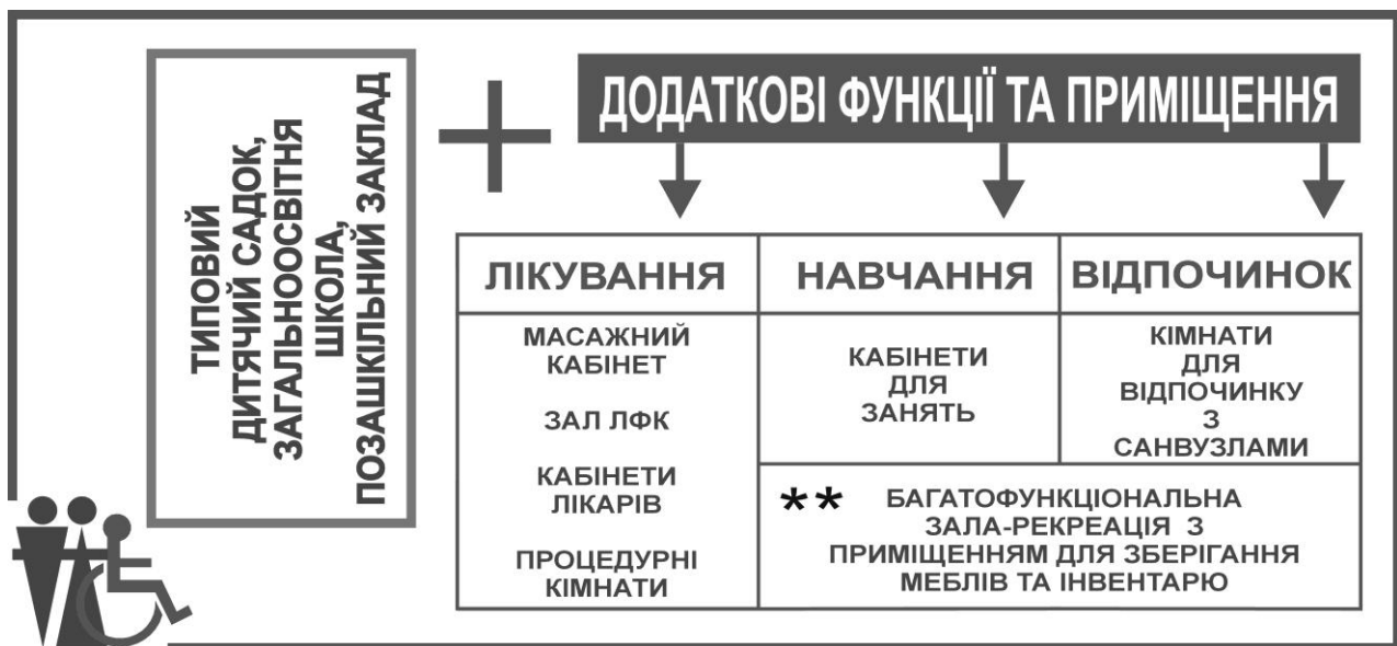
Рис. 1. Функції та приміщення, що необхідно додати до основного складу приміщень дитячого закладу для функціонування реабілітаційного осередку малої місткості.

Для реабілітаційного осередку (інтегрованого блоку) малої місткості орієнтовна кількість відвідувачів – до 20 осіб. Така кількість передбачає виникнення та сполучення певної кількості функціональних складових та, як наслідок, кабінетів та груп спеціальних приміщень (рис.1).