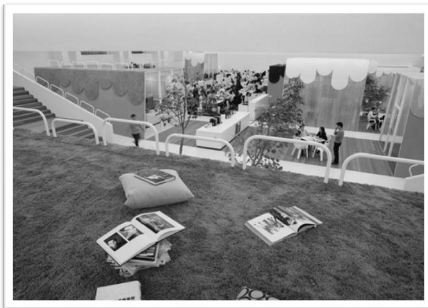
Рис.1.Штаб-квартира рекламного агентства ТВВА\НАКУНОДО,Токіо

зал ніби оперезаний 27 дерев'яними балками, які на стелі виконують функцію ламп, а потім по стінах плавно перетікають в книжкові стелажі з лавами. За допомогою обробки фото авторами статті в програмі Photoshop прослідковується подібність геопластики рисових терас та архітектурного вирішення бібліотеки (рис.2).