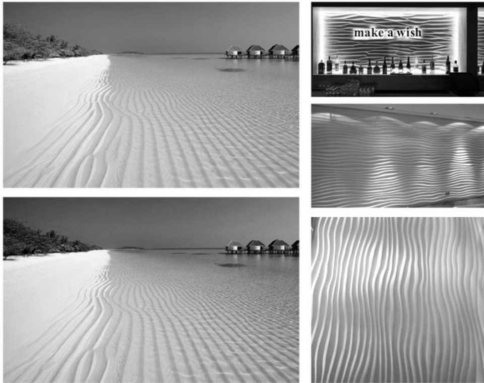
Рис.3 Відтворення рельєфа морського пляжу в інтер'єрі за допомогою 3Дпанелей

Рельєф морського пляжу о. Мальдіви можна відобразити в інтер'єрі за допомогою сучасних об'ємних настінних 3Дпанелей від Degesso (рис.3).