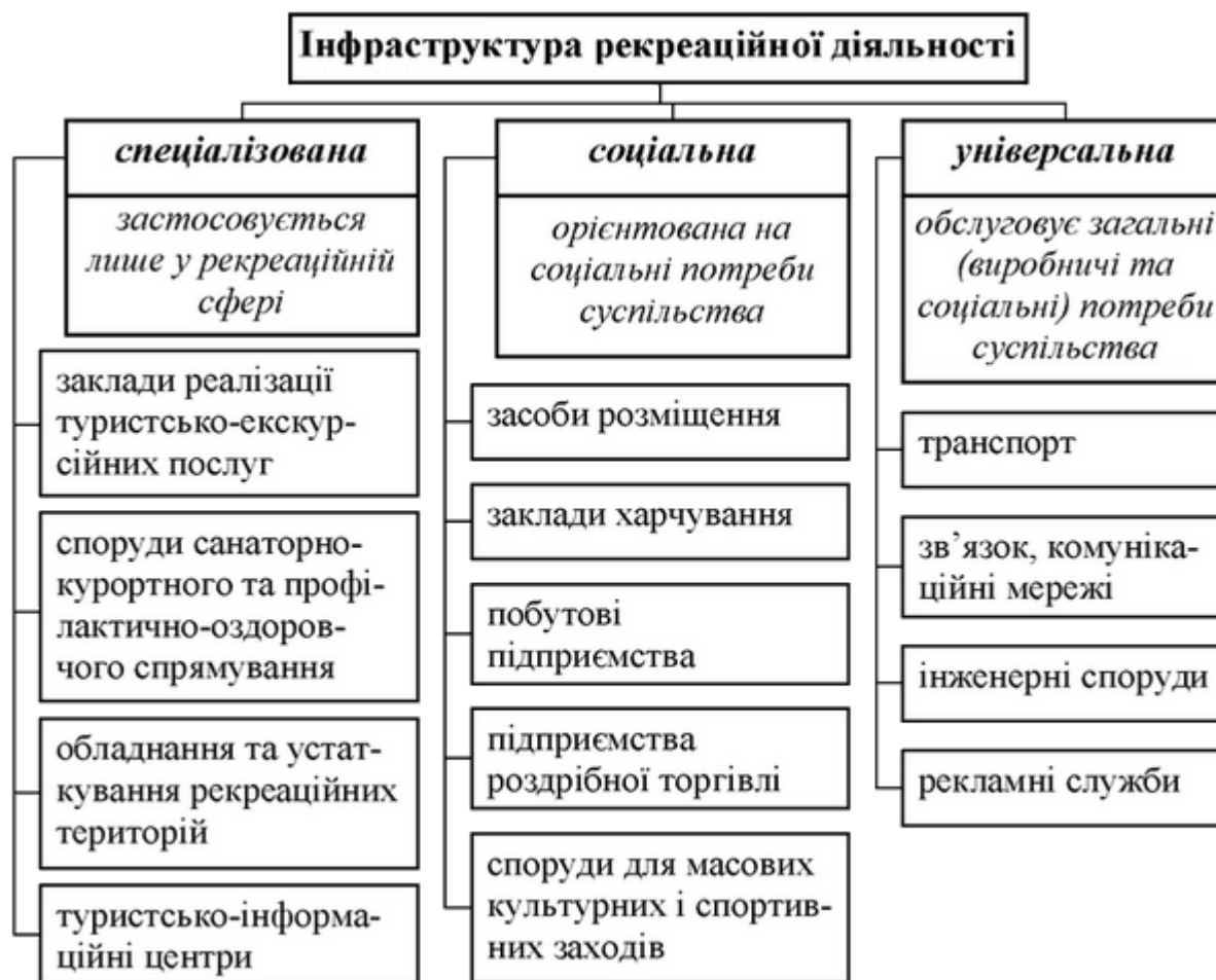
Рис. 1. Види інфраструктури рекреаційної діяльності залежно від задіювання у рекреаційній та інших сферах життєдіяльності людини (В.І. Новикова, 2010)

неї неможливо займатися певним видом рекреаційної діяльності, та звичайну, що створює комфортні умови для рекреації .