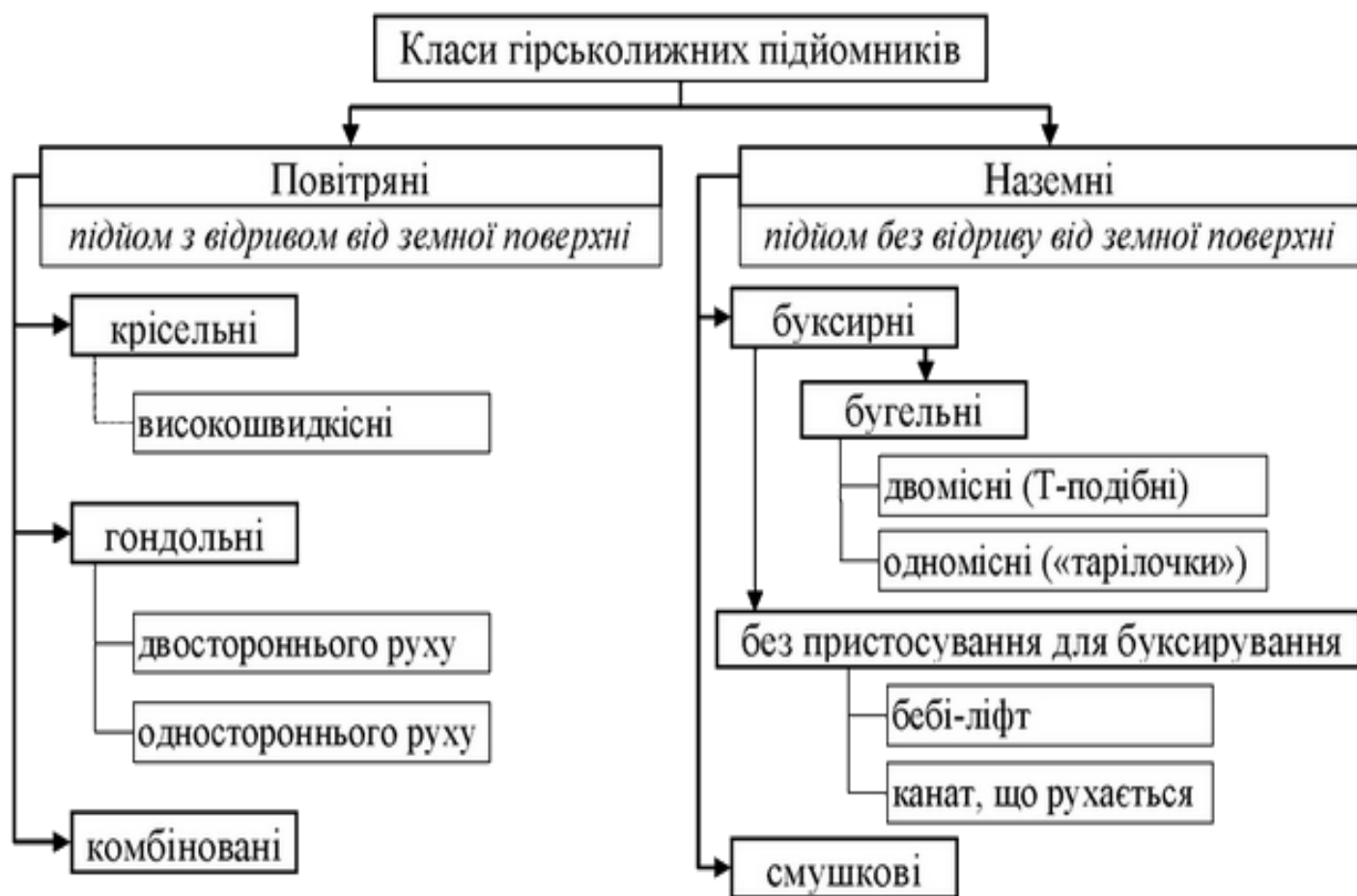
Рис. 2. Класи та типи гірськолижних підйомників (за матеріалами)

Невід'ємною складовою інфраструктури будь-якого гірськолижного курорту є підйомник - технічна споруда в гірській місцевості, призначена для підйому гірськолижників і сноубордистів до місця початку спуску. Розрізняють два основних класи гірськолижних підйомників: повітряні та наземні (рис. 2).