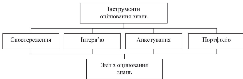
Рис. 1. Інструменти оцінювання знань студентів

У межах модульно-рейтингової системи навчання оцінювання [4, 9–11] здійснюється у декілька етапів (рис. 2):