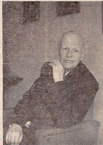
ри системи інженера М. М. Жербіна.

За цей період під керівництвом М. М. Жербіна розробляються проблеми, які мають важливе значення для народного господарства. Так склалося, що вся наукова діяльність вченого спрямована на розробку сталевих і дерев'яних конструкцій для споруд вугільних шахт. В 1941 році йому було доручено проєктування і зведення заводу важких авіаційних бомб на півночному Уралі, а також проєктування споруд вугільних шахт Кизеловського вугільного басейну. А в 1944 році Михайла Михайловича було призначено начальником Центрального бюро копрів і шахтного обладнання і доручено відновлення всіх металевих конструкцій і індивідуального гірничого обладнання зруйнованих вугільних шахт Донбасу. Тоді й були запропоновані, які здобули величезне поширення шахтних копрів з застосуванням тонкостінних сталевих циліндричних оболонок як основних несучих і захисних конструкцій — універсальні циліндричні коп-