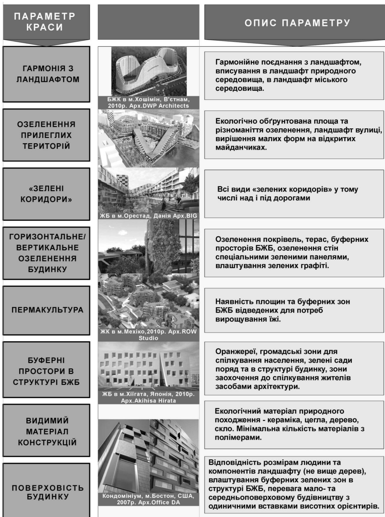
Рис.2. Параметри екологічно красивого багатоповерхового житлового будинку (БЖБ)