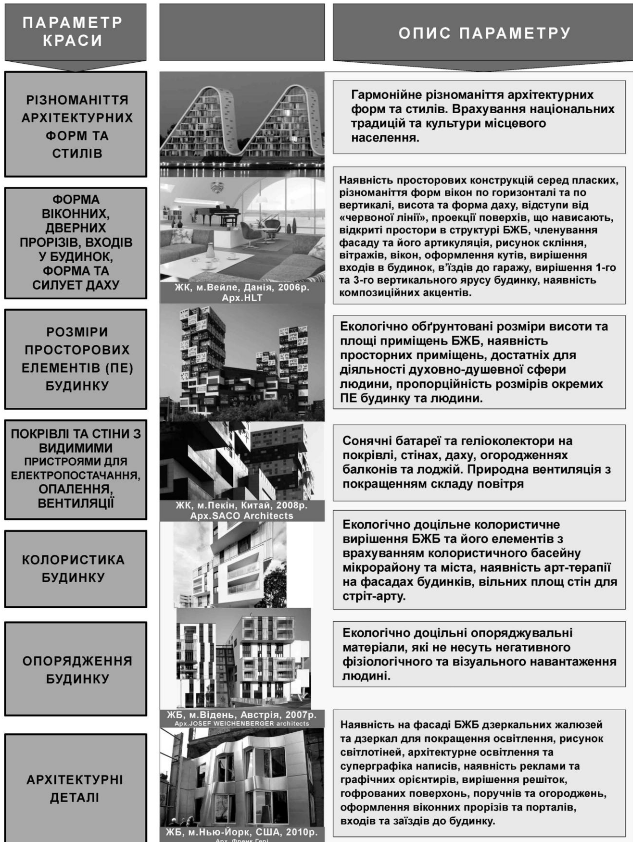
Рис.3. Параметри екологічно красивого багатоповерхового житлового будинку (БЖБ)