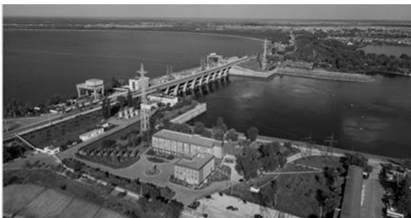
Рисунок 1. Гребля Київської ГЕС.

До таких об'єктів відносять комплекс інженерних споруд гідроенергетики, в склад яких входять греблі, які переважно сконцентровані на Дніпровському каскаді (Київська ГЕС, Канівська ГЕС, Дніпровська ГЕС тощо) та Дністровському каскаді і становлять найбільш відповідальними інженерними спорудами з підвищеною економічною, соціальною і екологічною значимістю (рис. 1).