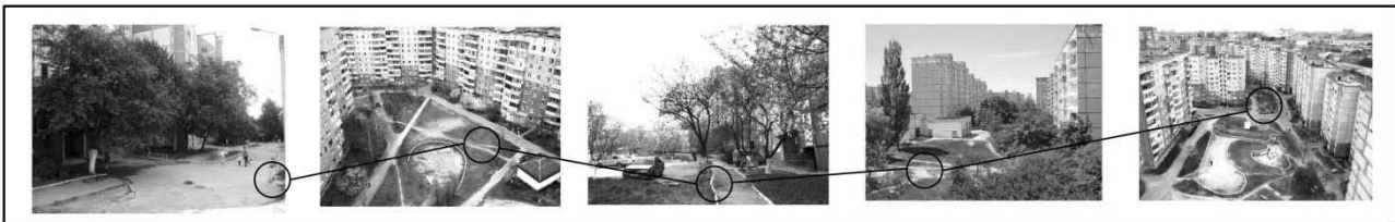
Рис.2 Існуючий стан пішохідних просторів житлових районів міст України (на прикладі м. Рівне)

Важливою є роль пішохідних вулиць у генезі загальної міської культури і дизайну ХХ століття. Белов М.І. визначив основні передумови виникнення цієї форми організації міського простору. Він визначив основні принципи організації предметно-просторового середовища (дизайну) пішохідних вулиць, на основі ретроспективного аналізу вітчизняного та зарубіжного досвіду розкрив особливості дизайну пішохідних вулиць у його взаємодії з архітектурою, скульптурою і монументально-декоративним мистецтвом. Такий аналіз допомагає нам створити персональне уявлення, яким має бути міський пішохідний простір.