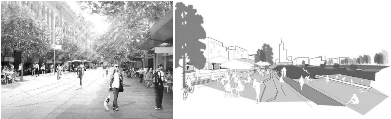
Рис.4 Організація пішохідних просторів. Проекти архітектурної компанії Gehl Architects.

Прикладом такого підходу може слугувати робота провідної архітектурної компанії Gehl Architect, яка займається розробкою інноваційних містобудівних проектів покращення міського середовища, виділяючи три групи факторів зручності міського пішохідного простору: безпека і захист (захист від автомобілів та несприятливих погодних умов, безпека від злочину), комфорт (зручність ходити, зручність стояти, візуальне сприйняття, місце відпочинку, можливість спілкуватись, можливість гратись та розважатись) та задоволення (масштаб, погода, позитивне сприйняття місця). Кожен з цих факторів тісно пов'язаний з переліком питань на які необхідно дати відповідь, задля усвідомлення стану проблеми.