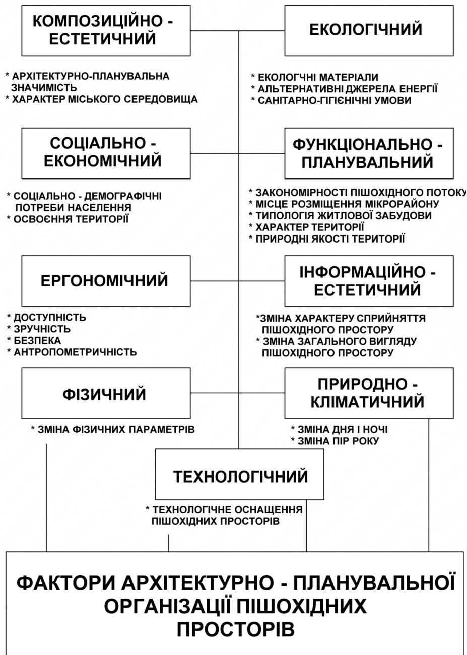
Рис.3 Фактори архітектурно – планувальної організації пішохідних просторів.

Розуміючи всю важливість даного питання, ми ставимо перед собою чітке завдання – змінити просторове відношення архітектурних об'єктів до навколишнього середовища, задавши пішохідним просторам нових умов сприйняття. Намагаючись закласти в концептуальну теоретичну модель стратегію подальшого розвитку з створенням повноцінного і різноманітного середовища, ми зможемо отримати середовище найвищого ґатунку, яке б задовольнило найвибагливішого споживача.