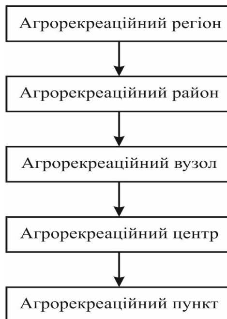
Рис. 2. Рівні агрорекреаційних утворень

5) агрорекреаційний регіон – це велика природно-етнокультурно-адміністративна територіальна одиниця, до якої можуть входити від однієї до кількох адміністративних областей, що характеризуються подібністю рис природно-ландшафтної будови, історико-культурного і соціально-економічного розвитку, традицій агрокультури, визначеними інфраструктурними зв'язками та іншими факторами [4].