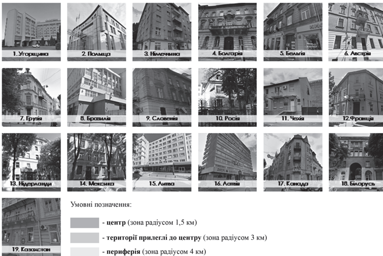
Рис. 4. Схема розміщення консульських представництв Львова.