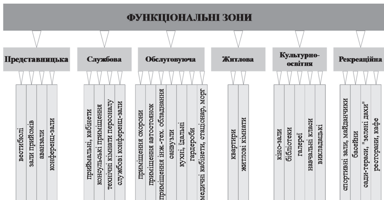
Рис.3. Функціональне зонування дипломатичної установи.

Для забезпечення нормального функціонування дипломатичної установи потрібен поділ простору на функціональні зони (рис 3.).