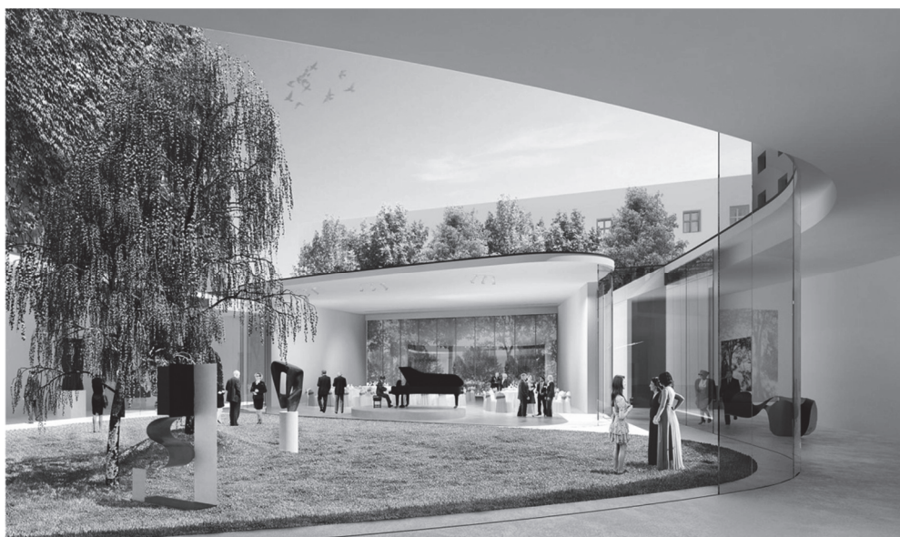
Рис. 2. Внутрішнє подвір'я Польського посольства в Берліні, Німеччина (проект)[9]

Проведення прийомів, як правило, відбувається в резиденції посла або в будівлі посольства. З урахуванням правового статусу резиденції посла та посольства, гості, які відвідують прийом, ніби опиняються на території держави, яку представляє посол. Якщо прийом влаштовується з нагоди національного свята або на честь високого гостя, в кінці прийому можлива організація невеликого концерту або показ фільму. У різних країнах прийоми такого роду нерідко проводяться на відкритому повітрі - на терасі або в саду (рис. 2). Під час таких прийомів можливі концерти, виконується національна музика приймаючої країни і країни гостя. Перед будівлею, де проходить прийом, іноді вибудовується почесна варта, яка віддає військові почесні приїзди і від'їзди головного гостя [4].