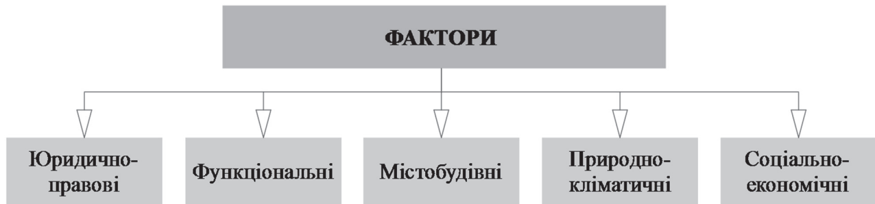
Рис. 1. Фактори, які впливають на проектування об'єктів для дипломатичної діяльності.

Щоб напрацювати єдину концепцію для проектування та будівництва українських дипломатичних представництв, проведено ретельний аналіз факторів, які на них впливають (рис. 1).