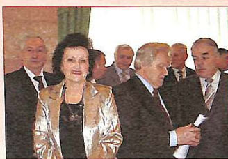
Ректори київського регіону