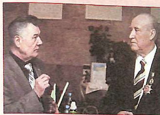
Герой України, випускник КНУБА О.Омельченко