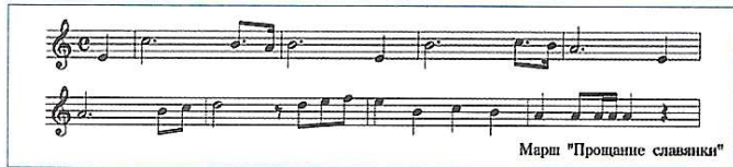
Марш "Прощання слав'янки"

До редакції А+Б звернулася група студентів КНУБА і попросила розповісти про історію створення відомого маршу "Прощання Слов'янки", якого виповнилось недавно 95 років, і опублікувати в А+Б його слова. Добре, що молодь університету знає про існування цього маршу. Виконуємо ваше прохання. Трохи історії.