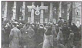
Мітинг киян біля університету ім. Шевченка, присвячений святку 1-го травня. 1942 р.