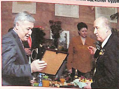
Міністр оборони України Ю.Єхануров

У день свого ювілею, ректор КНУБА отримав величезну кількість привітань. Насамперед привітання від Президента України Віктора Ющенка. Міністр оборони України Юрій Єхануров, депутати Верховної ради України, Герої України Володимир Поляченко, Олександр Омельченко, Микола Орленко – президент корпорації "Укреставація", президент Академії педагогічних наук НАН України Василь Миськобуд" Петро Шилук з членами колегіуму, випускниками КНУБА, прибули вітати персонально. Одним словом, протягом цілого дня д.т.н., професор А.М.Тугай приймав вітання від колег будівельників, науковців та співробітників університету. Для читачів А+Б – фоторепортаж!