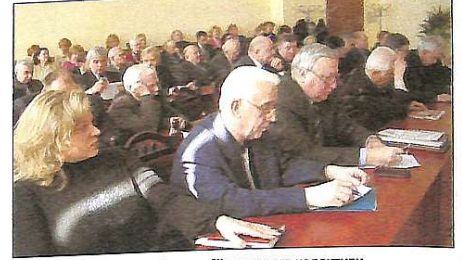
На конференції трудового колективу

2. Оплата праці працівників здійснюється в першочерговому порядку. Всі інші платежі здійснюються після виконання зобов'язання щодо оплати праці. 3. За порушення законодавства про оплату праці винні особи притягаються до дисциплінарної, моральної, адміністративної та кримінальної відповідальності згідно з законодавством.