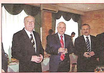
Ювіляра вітають науковці