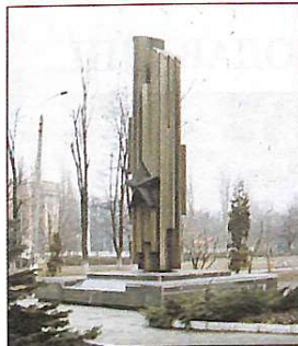
Пам'ятний знак загиблим під час Великої Вітчизняної війни студентам, викладачам і співробітникам КНУБА

Фронтівки в тилу ворога, народні месники – партизани у Великій Вітчизняній війні... Народна боротьба в тилу ворога на тимчасово окупованих радянських землях – яскрава сторінка в історії перемоги над німецько-фашистськими загарбниками. Сьогодні студентська газета розповідає саме про цю сторінку озброєної боротьби радянського народу 1941–1945 років за Перемогу над фашистською Німеччиною. Допомагає нам книга колишнього військового розвідника доцента кафедри політичних наук КНУБА, полковника у відставці Олександра Петровича Кутузова "Фронтівки і наслідки: Воспоминання. Размышления. Надежды. Киев. 2005 год" та історичний нарис "Киевский ордена Трудового Красного Знамени инженерно-строительный институт. 1991 год".