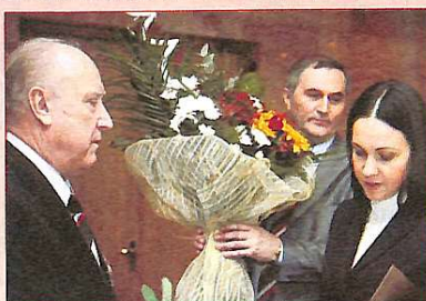
Вітання від Президента