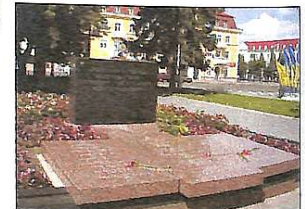
Чернігів. Красна площа. "Вічна пам'ять героям"

Чернігів став потужним промисловим і культурно-освітнім центром