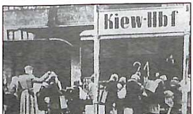
Відправка киян до Німеччини товаряком. 1942 р.