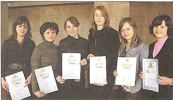
В руках студентів – низка дипломів