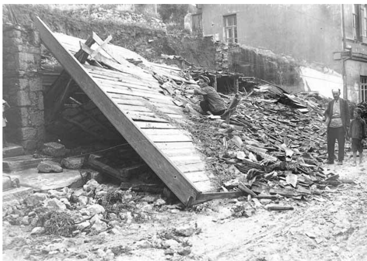
Рис.1. Наслідки землетрусу в Ялті, 1927 р.

В Україні руйнівний землетрус відбувся в Криму у 1927 році (інтенсивністю 9 балів) рис.1, попередній землетрус був в 1838 році, тобто інтервал складає близько 90 років.