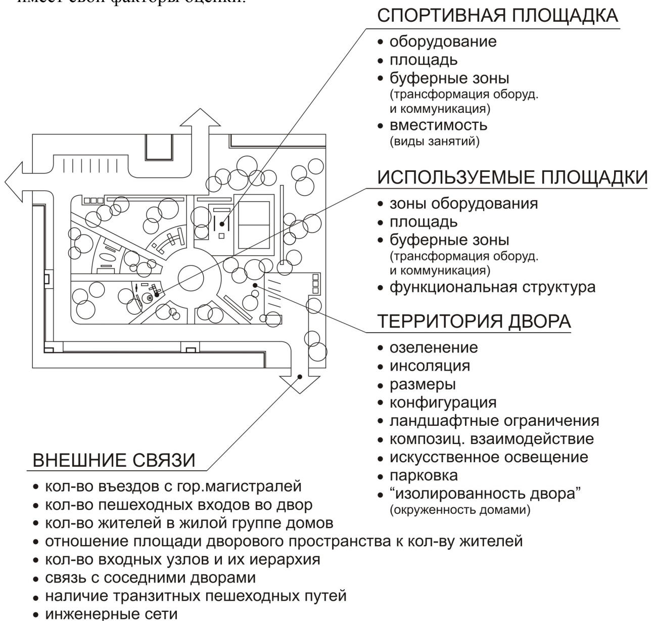
Рис.1. Планировочная структура дворового пространства

При оценке дворового пространства можно выделить такие степени организации: площадка, территория двора и внешние связи. Каждый из уровней имеет свои факторы оценки.