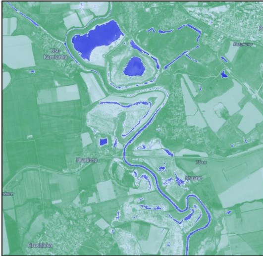
Рисунок 1. Зображення поверхневих вод із застосуванням індексу NDWI

поверхневих вод, а дослідники постійно створюють альтернативні моделі для підвищення точності результатів моніторингу. Найпоширеніший показник для виявлення і моніторингу змін водних об'єктів – нормалізований водний індекс (NDWI), який ґрунтується на різниці між максимальним відбиттям поверхневої води в зеленій смузі і відбиттям неводних поверхонь у ближній інфрачервоній смузі, і він був успішно використаний у багатьох дослідженнях (Рис.1) [5, 6, 8].