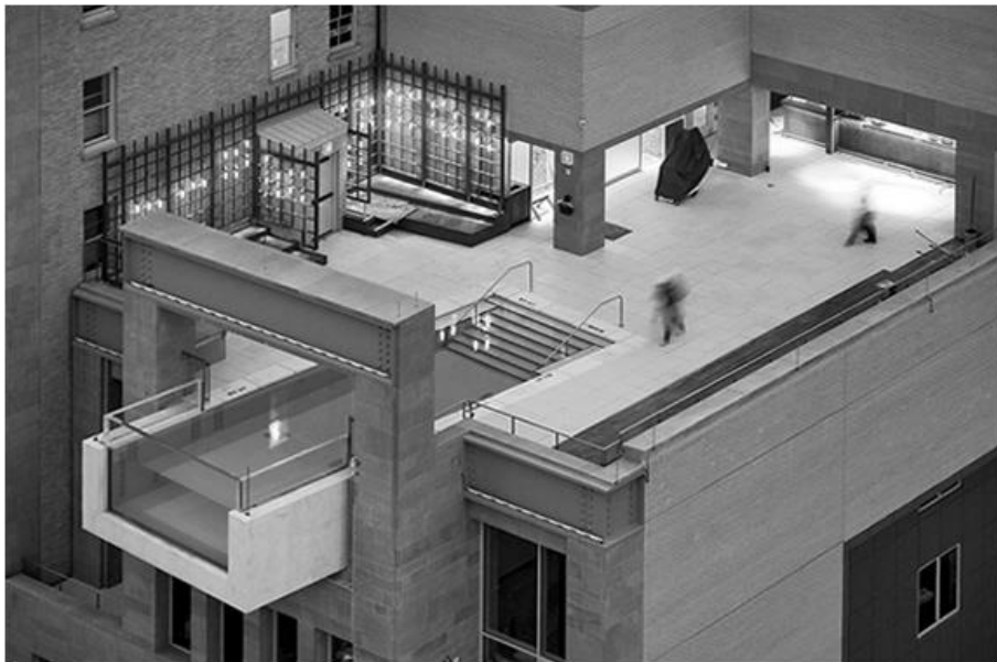
Рис. 1. Приклад експлуатованого даху в готелі Joule, Даллас (США)

Наприклад, цікаво вирішений простір даху готелю Joule в Далласі (США) (див. рис.1 ). Домінантою композиції є басейн, частина прозорого обсягу якого виступає за грань зовнішньої стіни, що дозволяє відчувати паріння в повітрі.