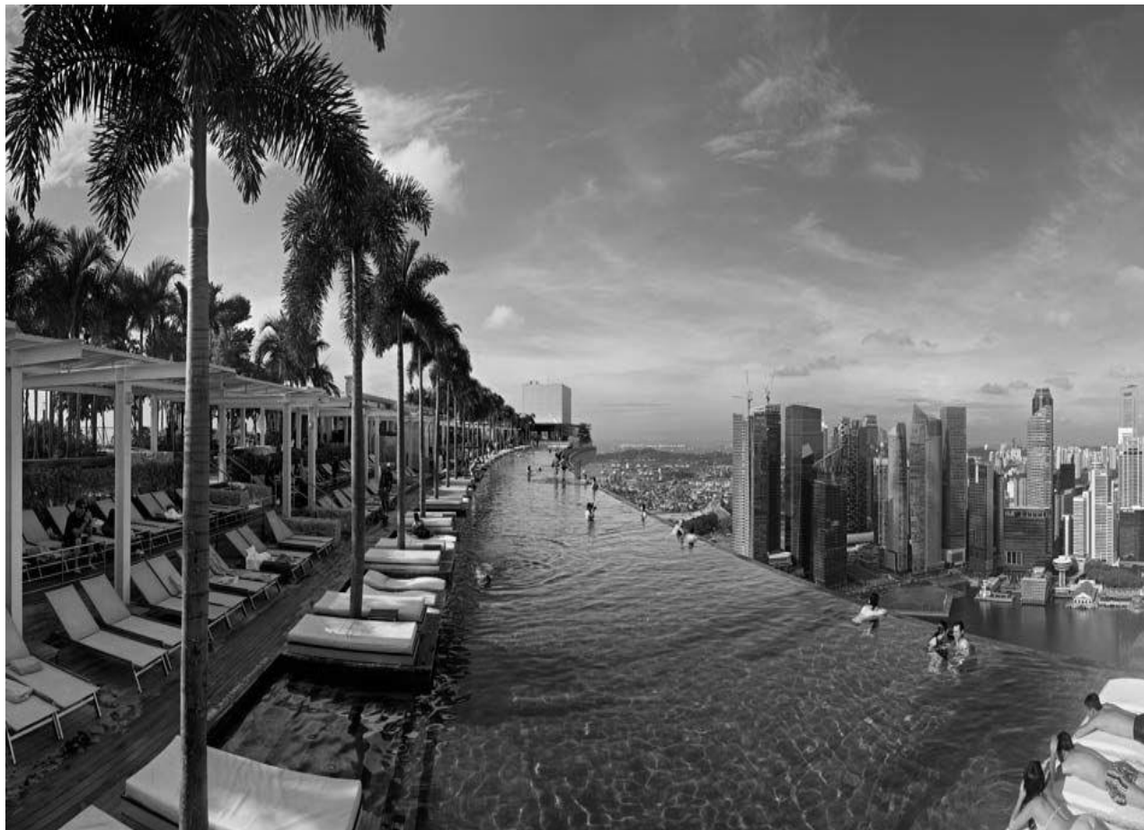
Рис. 2. Приклад експлуатованого даху в комплексі Marina Bay Sands, Сінгапур.

Басейн на даху комплексу Marina Bay Sands в Сінгапурі (див. рис. 2) становить 150 м в довжину. В даному випадку незвичайна конструкція бортів дозволяє організувати водний простір таким чином, що створюється враження переливання води на стіни і стікання вниз в нескінченність.