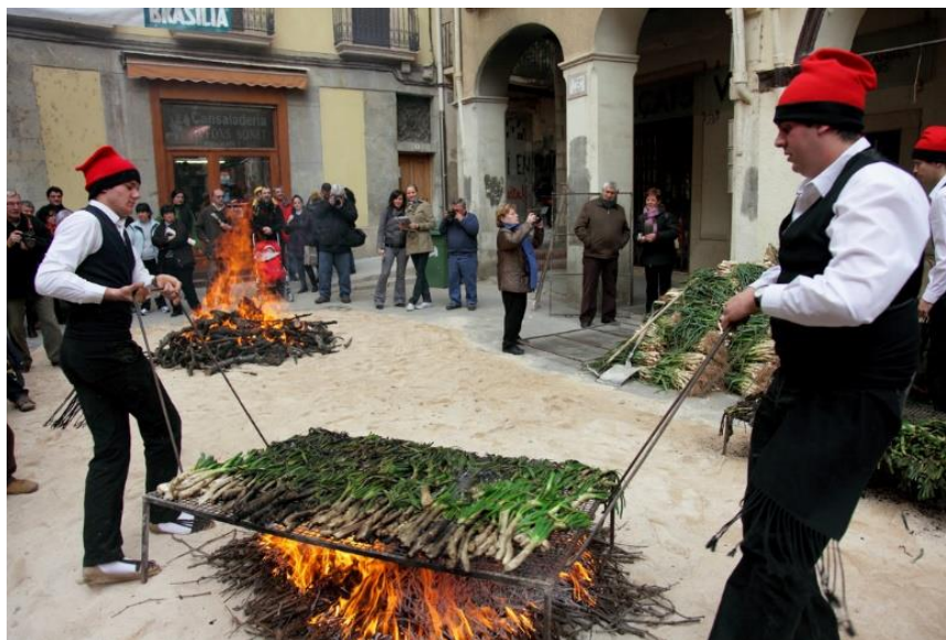
Рис. 3.5 Fiesta de la Calçotada

Свято цибулі, відоме як Кальсотада, є традиційним каталонським фестивалем, присвяченим особливому виду цибулі – кальсотс. Ця молода біла цибуля вирощується за специфічною технологією і ззовні нагадує порей. Урожай збирають наприкінці зими, коли кальсотс стає солодкуватою на смак. Основною стравою та символом свята кальсотада є кальсот, який обвуглюють на грилі та зазвичай подають загорнутим у газету. Його подають гарячим прямо з гриля, зазвичай, порція містить приблизно 25 цибулин. Перед споживанням обвуглене стебло слід очистити від зовнішньої шкірки та занурити в спеціальний соус, що може бути доволі неохайним процесом. Популярний каталонський соус Ромеско готується з солодкого червоного перцю, томатів, часнику, оливкової олії та перетертих із сухарями горіхів, зазвичай мигдалю. За легендою, перший кальсот був вирощений у містечку Бальш у провінції Таррагона селянином на ім'я Шат де Бенейжес. Саме він вигадав спосіб приготування цієї цибулі на вогні. Ідея швидко здобула популярність серед жителів цього міста завдяки своєму смаку й простоті приготування. З кінця XIX століття ця традиція передається з покоління в покоління, а Бальш став столицею Кальсотс або, як її ще називають, «Землею цибулі». Щороку в січні тут проходять урочистості та дегустації, що прославляють місцевий врожай.