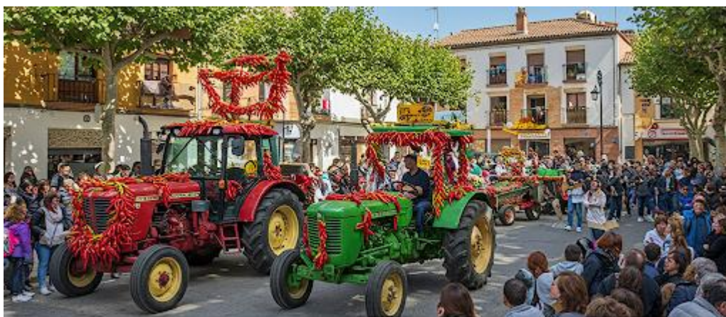
Рис. 3.8 La fiesta del Pimiento

Цей фестиваль проходить в першу суботу серпня в містечку Падрон. Вперше він був організований у 1968 році, що підкреслює його тривалу традицію, і щороку зростає кількість відвідувачів, які приїжджають, щоб насолодитися свіжоприготовленим перцем, привезеним, як вважається, з американських земель. Захід відбувається в дубовому гаю францисканського монастиря Гербон, де відвідувачі можуть безкоштовно скуштувати страви, а також спостерігати за процесією прикрашених тракторів та насолоджуватися музичними виступами.