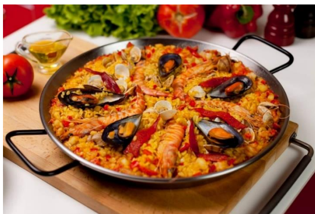
Рис. 2.4 «Паелья» з морепродуктами

До списку найвідоміших іспанських страв належить паелья, одна з найбільш популярних страв іспанської кухні. За легендою, традиційний рецепт з'явився у Валенсії, де його придумали слуги мавританських монархів, які збирали залишки їжі після бенкетів і додавали їх до рису. Через це в арабській мові "паелья" означає "залишки". Існує ще одна історія про рибалку, який готував їжу з продуктів, що були в коморі, поки чекав на дружину. За цією версією, "паелья" перекладається як "для неї". Основним компонентом цієї смачної іспанської страви є рис з ароматним шафраном та оливковою олією. У паелью також додають зелені овочі, морепродукти або куряче м'ясо. Існує безліч варіацій цієї страви; кожен регіон країни має свою особливу рецептуру, але в класичному варіанті завжди є кілька видів риби, рис, біле вино і спеції. М'ясо та рис роблять цю іспанську страву не лише дуже смачною, але й поживною. Традиційно паелья прикрашає кожен недільний обід і є невід'ємною частиною столу на свято Святого Йосипа.