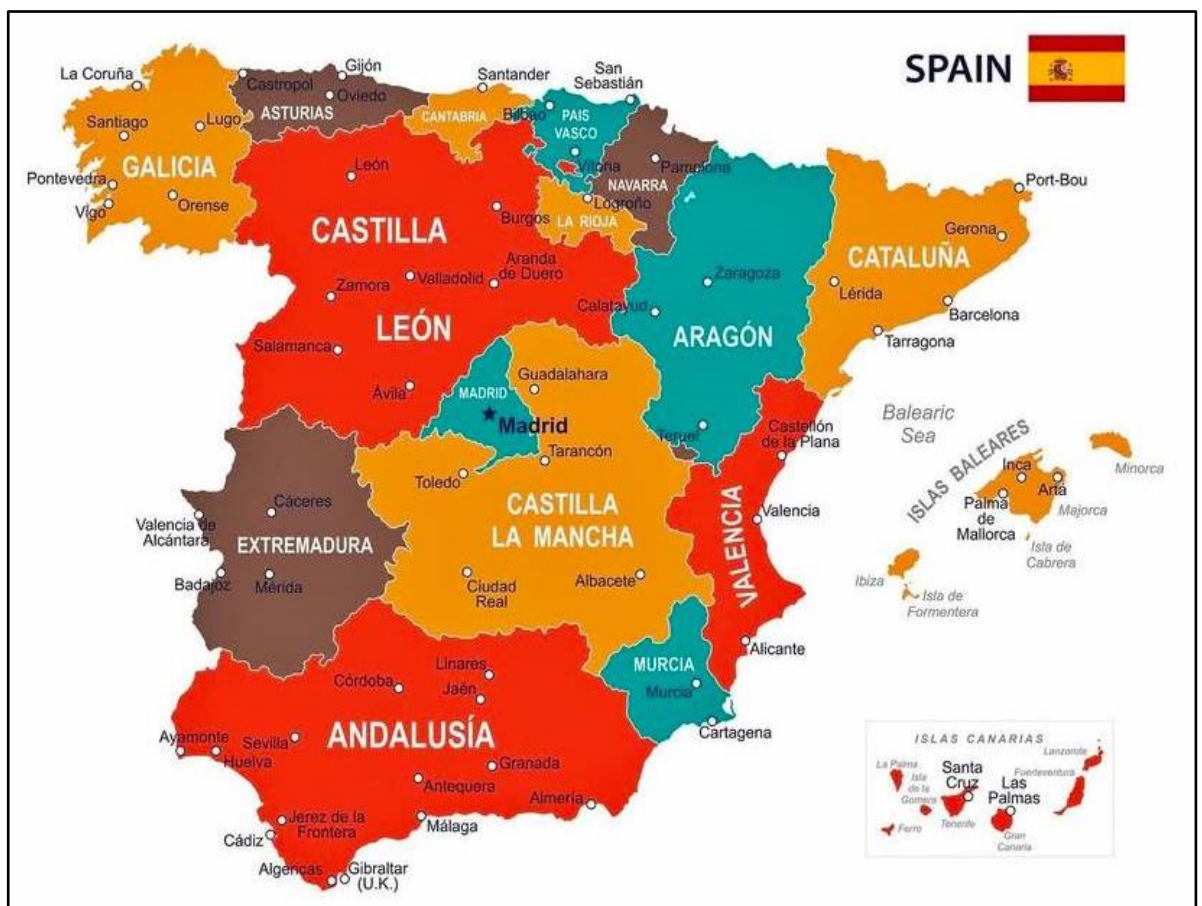
Рис. 2.14 Адміністративний поділ Іспанії

Кожен регіон володіє особливими гастрономічними традиціями, що з гордістю представляють унікальні аромати місцевих сезонних продуктів. Іберійський півострів демонструє різноманітність кулінарних пропозицій: від свіжої соковитої риби та морепродуктів, що дарує узбережжя, до високоякісних овочів і фруктів родючих долин, і вишуканих м'ясних страв у гірських місцевостях.