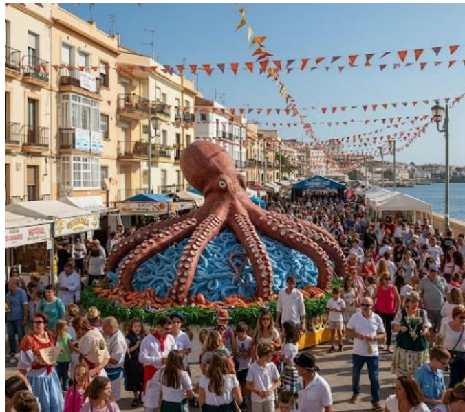
Рис. 3.1 La Fiesta del Pulpo

скуштувати найсмачнішого молюска, приготованого в великих мідних котлах. Галісійська кухня славиться різноманіттям риби та морепродуктів, які мають особливий смак і свіжість. Для створення традиційної страви використовується 25-30 тонн восьминога, який є улюбленою їжею мешканців Оренсе та справжнім символом гастрономії Галісії. Він вирізняється особливою текстурою та злегка пряним смаком. Щороку місцеві жителі ретельно готують велику закуску зі свого відомого молюска – pulpo a la gallega, до того ж кількість приготовленої їжі постійно зростає. Як додаток до восьминога подають інші типові страви Галісії: свіжий хліб, випечений за старовинним рецептом, домашні пироги Емпанадас і вино Рібейро.