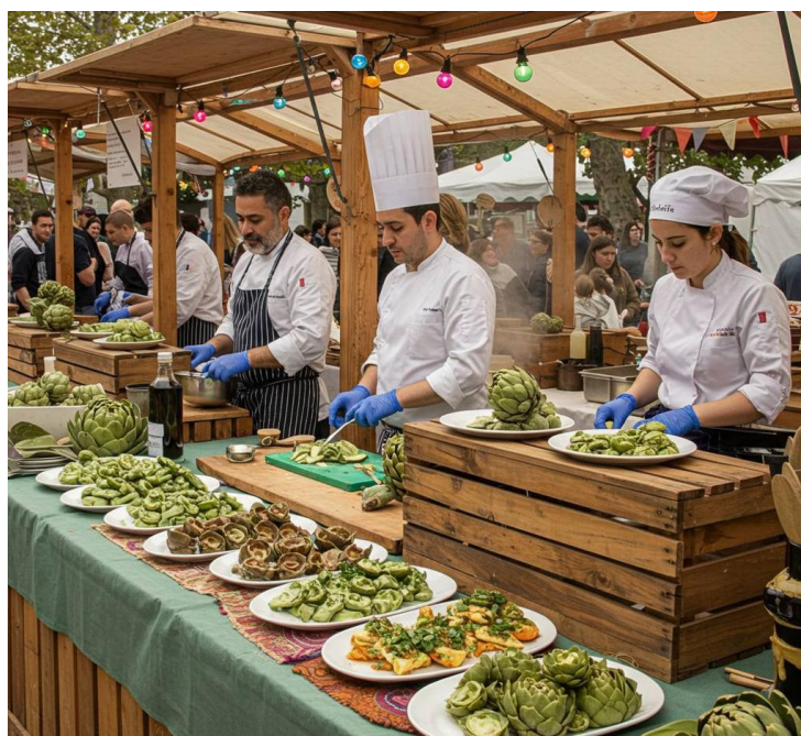
Рис. 3.7 Fiesta de la Alcachofa

Фестиваль, що відбувається на початку березня, є присвяченням одному з найвидатніших овочів Іспанії — артишоку. Це свято проходить у місті Бенікарло, розташованому в регіоні Валенсія, і пропонує різноманітні заходи, такі як кулінарні змагання, гастрономічні демонстрації та продовольчі ринки. Зокрема, видатні шеф-кухарі з Валенсії, беруть активну участь у фестивалі, презентуючи вишукані страви, в яких використовують артишок.