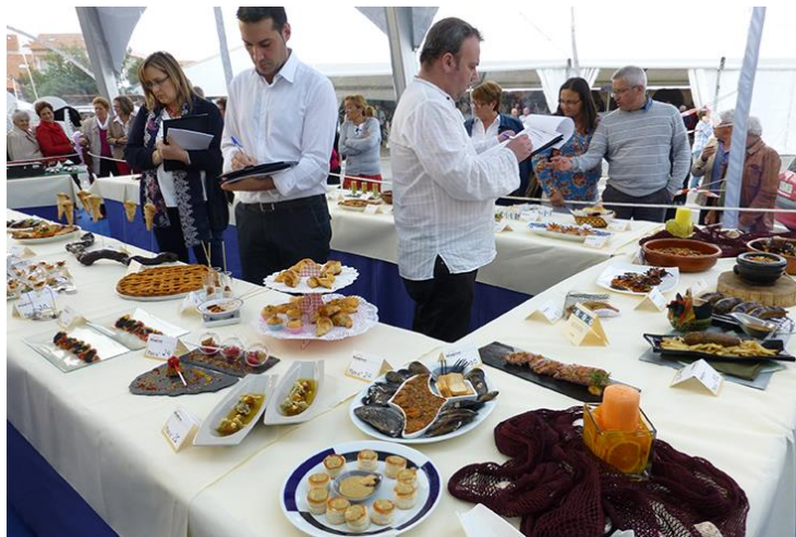
Рис. 3.3 Fiesta del Marisco