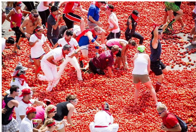
Рис. 3.6 La Tomatina