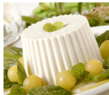
Рис. 2.13 Сир «Бургоський»

У іспанській кухні також дуже популярними є напої. Вони відіграють важливу роль, їх використовують для приготування коктейлів і додають у різноманітні десерти.