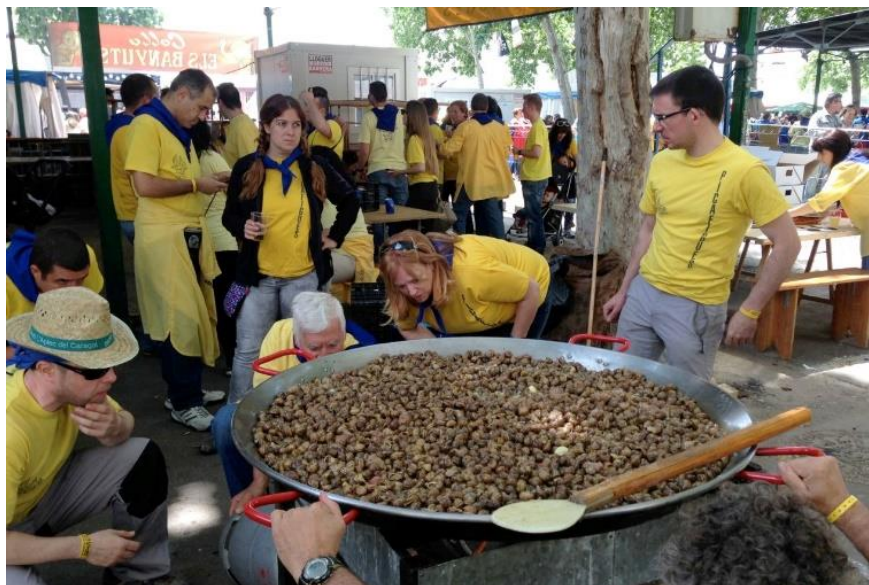
Рис. 3.2 L'Aplec del Caracol

Найпростіша і найпопулярніша страва — це равлики, приправлені сіллю та перцем, приготовані на звичайній бляшанці.