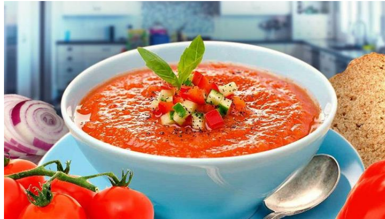
Рис. 2.6 Традиційний іспанський томатний суп «Гаспачо»

він настоюється в холодильнику. На стіл його подають разом з сухариками або овочевим гарніром. Страва здобула популярність завдяки ніжній консистенції та приємній прохолоді, яка дуже бажана в спекотний день. Хоча рецепт до нас прийшов з Андалусії, гаспачо вважається національним блюдом іспанської кухні і відоме у всьому світі.