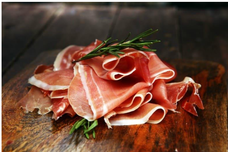
Рис. 2.10 Національний іспанський делікатес «Хамон»

Найвідоміший іспанський м'ясний делікатес у світі — це хамон. Він має багату історію, що підтверджують історичні документи. Його подавали на стіл римським імператорам і використовували для годування легіонерів. Існує кілька легенд про його походження. Одна з них говорить, що хамон винайшли відомі європейські роди, які прагнули продовжити термін зберігання м'яса, консервуючи його сіллю. Для іспанців приготування традиційного хамона є особливим ритуалом. Спочатку тушу обробляють, ретельно зачищають від жиру, засолюють морською сіллю і зберігають при температурі не вище +5 градусів. Після цього її промивають, в'ялять і витримують в прохолодному приміщенні протягом двох місяців. На завершальному етапі хамон просушують.