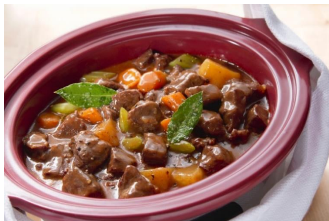
Рис. 2.7 Тушковане м'ясо з овочами «Олья Подрида»

Цю популярну страву в Галісії та Кастилії готують з тушкованих овочів і м'яса. Олья Подрида відома в традиційній іспанській кухні ще з часів хрестоносців; її назва означає "могутня", підкреслюючи велику кількість м'яса, яке було доступним лише заможним людям. Перед подачею страву розділяють на дві частини: юшку та м'ясо. До частування додають яечні коржики. Готується страва з квасолі, моркви, томатів, цибулі, свинячих ніжок та хвостів, ребер, вух, бекону, а також додають часник і ковбасу.