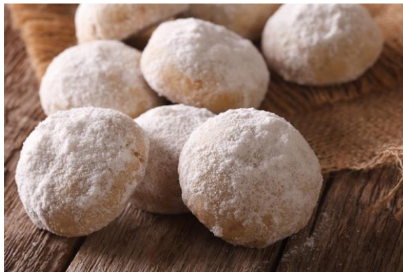
Рис. 2.9 Пісочне печиво «Польворон»

Легке, повітряне печиво, до складу якого входять борошно, цукор, різні горіхи та свинячий жир. В окремих іспанських регіонах жир замінюють на молоко або оливкову олію. Зовні десерт схожий на пряники, але текстура у нього легша. Готується польворон протягом двох днів.