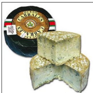
Рис. 2.11 Сир «Кабралес»

В Леоні та Кастилії найпопулярніший сир — бургоський, який може бути солоним або прісним (Рис. 2.13). Каталонія славиться чудовими сирами з козячого молока.