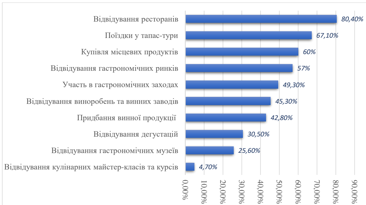
Рис. 2.15 Заходи, які проводять для гастрономічних туристів

Гастрономічні туристи часто поєднують свої кулінарні пригоди з іншими типами туристичного досвіду, акцентуючи на культурних аспектах, таких як відвідання міст (81,4%) та маршрути з оглядом культурних надбань (72,6%). Меншою мірою вони приділяють увагу екскурсіям на природі (57,5%), відпочинку (31,7%) та шопінгу (20,3%) під час подорожей. Близько 16,3% прагнуть присвятити себе особистому добробуту, відвідуючи бальнеологічні курорти та спа-центри, а 14,8% поєднують це з відвідуванням рідних та друзів. В середньому гастрономічний турист готовий витратити до 13 євро на особу за якісний гастрономічний сніданок із місцевими продуктами, хоча купуючи ті ж продукти окремо, він міг би викласти до 45,60 євро [44].