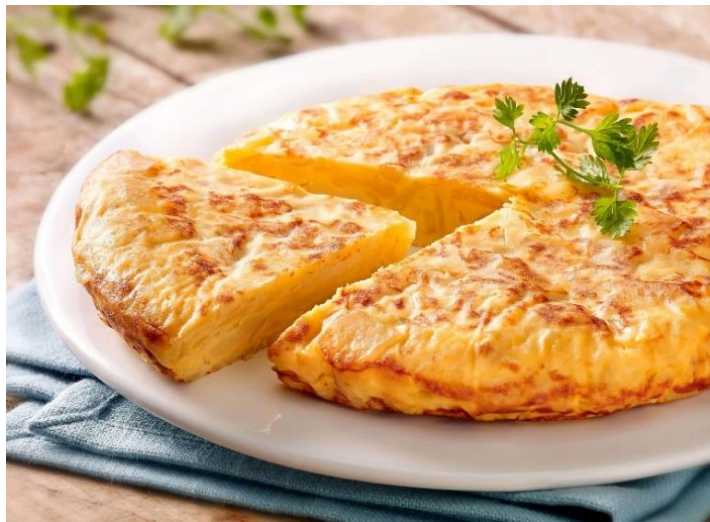
Рис. 2.5 «Тортилья» з картоплею та яйцями

Тортилья є однією з найпопулярніших і найвідоміших страв іспанської кухні. Її не слід плутати з мексиканським тонким коржем, виготовленим із кукурудзяного борошна. Іспанська тортилья — це смачна запіканка, основними інгредієнтами якої є картопля і яйця, а також додають різноманітні овочі, такі як помідори, кукурудза, зелений горошок, перець і цибуля. У різних куточках Іспанії існують свої варіації цієї страви з додатковими інгредієнтами, але картопля та яйця завжди залишаються її основою. Таку страву часто пропонують у кафе на сніданок. Апетитна тортилья також доступна майже у всіх супермаркетах і користується великою популярністю завдяки тому, що є ситною.