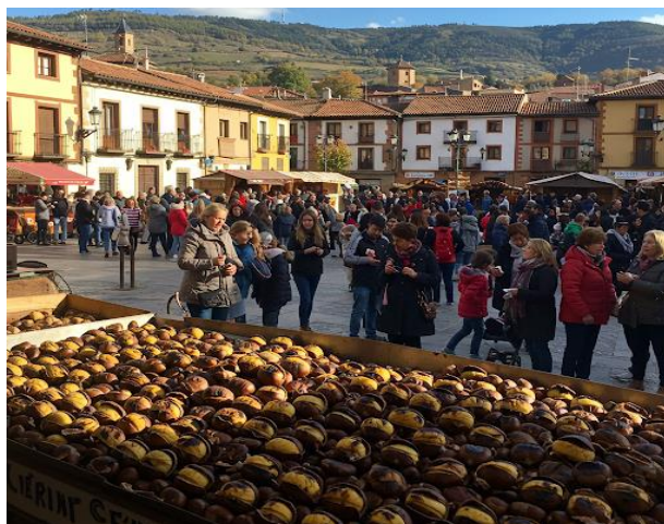
Рис. 3.4 Fiesta de la Castañada

Кастаньяда — традиційний осінній фестиваль, який також має назву свято каштанів. Він присвячений збору каштанів і символізує вдячність за зібраний урожай. Їх готують на вугіллі в залізному посуді з перфорованою основою, яку називають тіхоло. На каштанах роблять надріз, щоб вони не вибухали і не підстрибували під час смаження. Коли каштани готові, їх потрібно очистити та смакувати. Це свято відзначають напередодні Дня Усіх Святих, 31 жовтня, в окремих регіонах північної Іспанії, таких як Галісія, Кантабрія, Астурія, а також у провінціях Леон, Замора та Саламанка. Також його відзначають на деяких частинах Канарських островів. В Каталонії, по обидва боки французько-іспанського кордону, цей фестиваль є не менш важливим. Крім того, цей захід популярний у Португалії під назвою Магусто.