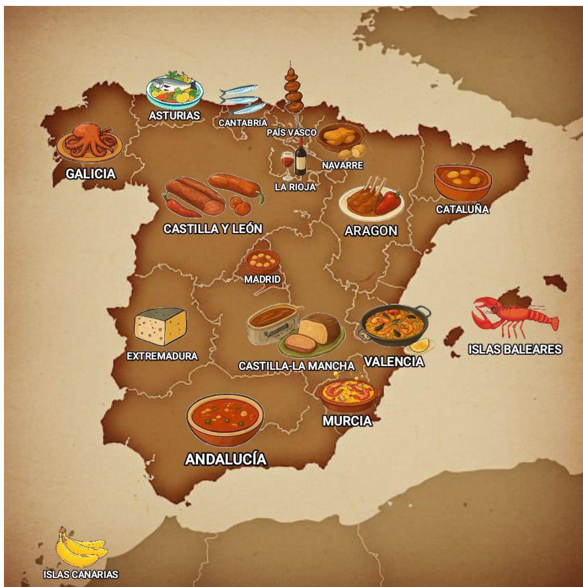
Рис 2.2 Особливості гастрономії по регіонах Іспанії

Іспанія може похвалитися чотирма регіональними кухнями: північною, середземноморською, кухнею месети та південною.