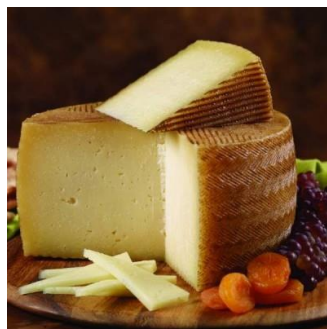
Рис. 2.12 Сир «Манчего»