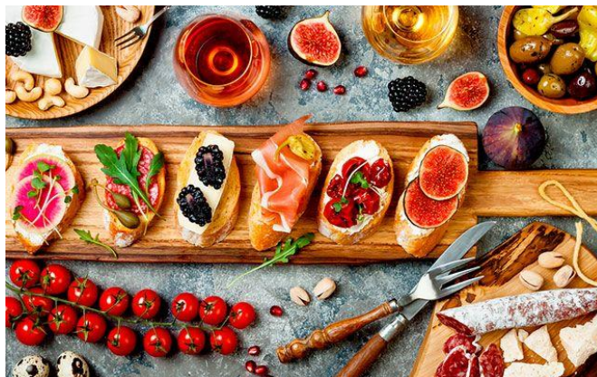
Рис. 2.3 Іспанська закуска «Тапас»