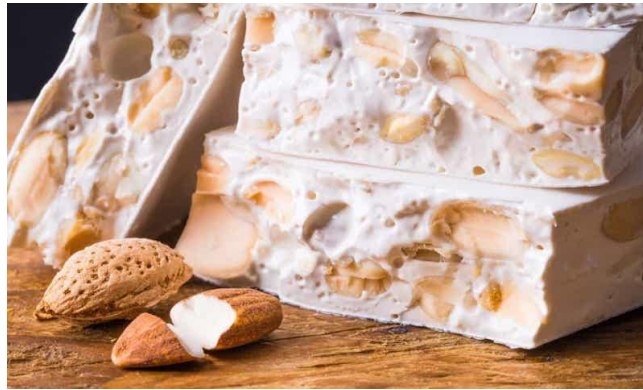
Рис. 2.8 Різдвяний іспанський десерт «Туррон»

Туррон, також відомий як нуга, — це десерт, що готується з обсмаженого мигдалю, меду та білка. У деяких регіонах до нього додають фрукти, попкорн або шоколад. Рецепт цієї традиційної солодощі був відомий ще стародавнім грекам, які готували її переважно для спортсменів, що брали участь в Олімпійських іграх. Але справжніми авторами туррона вважаються араби. Однак іспанці не бажали пов'язувати цей десерт з маврами і створили легенду про скандинавську принцесу та мигдальні дерева.