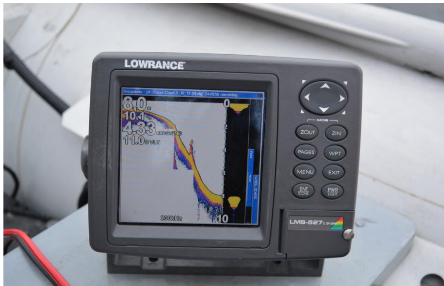
Рис. 3 – Ехолот - картплоттер LOWRANCE LMS-527C DF, який використовувався для дослідження

Для дослідження вмісту Co, Cu, Pb, Cd у воді, прибережному мулі, ґрунтах та водоростях зразки складових гідроекосистеми відбирали в 5 різних місцях Тернопільського ставу (рис. 1): 1 – біля міського пляжу; 2 – поблизу автомобільної дороги; 3 – біля заплави р. Серет (фільтр на шляху міграції елементів); 4 – в низинній ділянці ставу (надходження техногенних викидів із стоком, із річкової води, з атмосферних опадів); 5 – в ділянках заболоченого схилу (постійне обводнення).