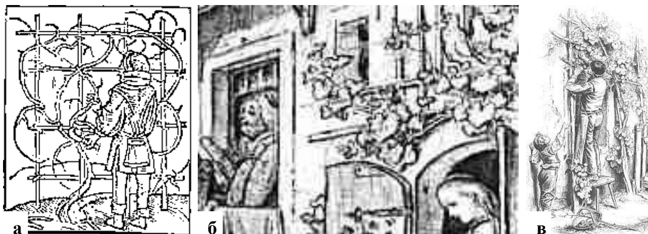
Рис.1. Історичні малюнки озелених конструкцій, першооснов пермакультури. а - Виноградні лози на шпалері – історичний опис (16-е або 17-е ст.) винний музей у Neuenburg/Freyburg, Unstrut (Saxony-Anhalt, Німеччина). б - Шпалера – історичний опис в малюнку, зробленому Л.Ріхтером. в - Збір урожаю винограду від грат, Оскар Плетч, приблизно 1870 р. [9].

НОВИЙ ЧАС 4-й етап (XX - XXI ст.) – період формування розвиненої інфраструктури рекреаційних просторів з елементами природнього середовища в різноманітних за функціональним призначенням будівлях та спорудах.[5, С. 157-158]