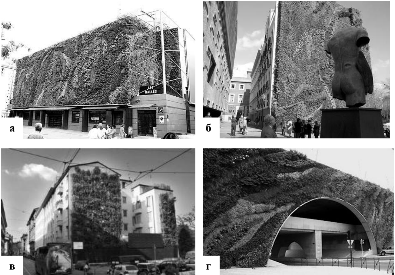
Рис.4. «Суцільна зелена стіна», дизайн ботаніка Патріка Бланка.

Безсумнівно, що будь-який сад на штучній основі повинен мати огороження – легке, прозоре або виконане у вигляді високого парапету, що обмежує огляд міського середовища. [6. С. 158]