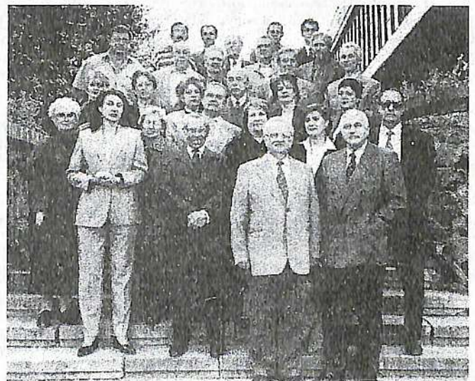
На згадку про ювілей

В дипломних та курсових проектах розробляються питання реконструкції і будівництва населених місць, міських інженерних споруд, інженерної підготовки, інженерного благоустрою міських територій, реконструкції парків, вулично-шляхової мережі, дорожньо-транспортних вузлів, транспортного обслуговування населення, безпеки дорожнього руху. За останні роки