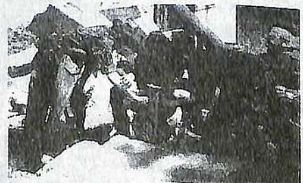
На заняттях по рятувальній підготовці студенти санітарно-технічного факультету.