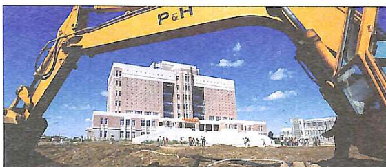
Китай. Будівництво університетської бібліотеки в м. Шеньян

Підсумовуючи все сказане про ювіляра, не можна не згадати й те, що професор Ковальський затвердився як авторитетний науковець з теорії архітектури та типології навчальних закладів. З під пера автора вийшло понад 200 наукових праць та близько 100 наукових публікацій з проблем архітектури, в т.ч. монографій. Серед них: "Архітектура учебных зданий" (1980), "Архитектурно-художественное оформление школы" (1984), "Архитектура учебно-воспитательных зданий" (1988), "Архитектура высших навчальних закладів" (2011) та