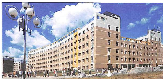
Китай. Університетські гуртожитки в Шеньяні