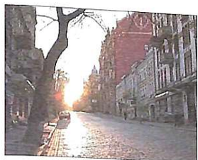
Тверде покриття на київській Прорізній вулиці. 1913 рік

На кінець XIX століття в Києві налічувалося 230 вулиць і 17 площ, які висвітлювалися майже 2000 газовими ліхтарями. У цей період дорожня інфраструктура міста почала розвиватися стрімкими темпами. Почали проводитися масштабні роботи з вищощення нових та ремонту старих вулиць. Київ був першим серед міст Імперії, де почали будуватися мозаїчні брукування на бетонній основі. Ці роботи охопили центральні магістралі: вулиці Хрещатик, Олександрівську, Миколаївську, Володимирську та ін. Граніт для цієї бруковки завозився зі Швеції. Вже в 1912 році половина вулиць міста мала тверде покриття.