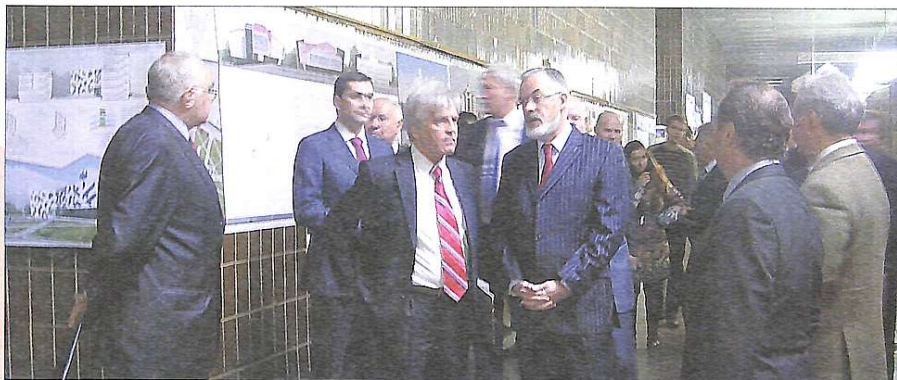
Міністр освіти Д.В. Табачник оглядає виставку дипломних робіт на архітектурному факультеті

Китаю, Молдови, Росії, голови і члени ДЕКів, що працювали цього року, викладачі, студенти та їх батьки.