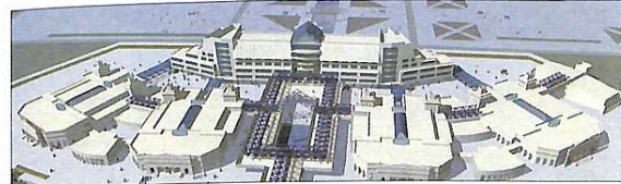
Проект лекційних аудиторій в м. Шеньян

велика кількість слухачів. Хочеться відзначити і активну громадську діяльність професора як члена Національної спілки архітекторів України, дійсного члена Української академії архітектури.