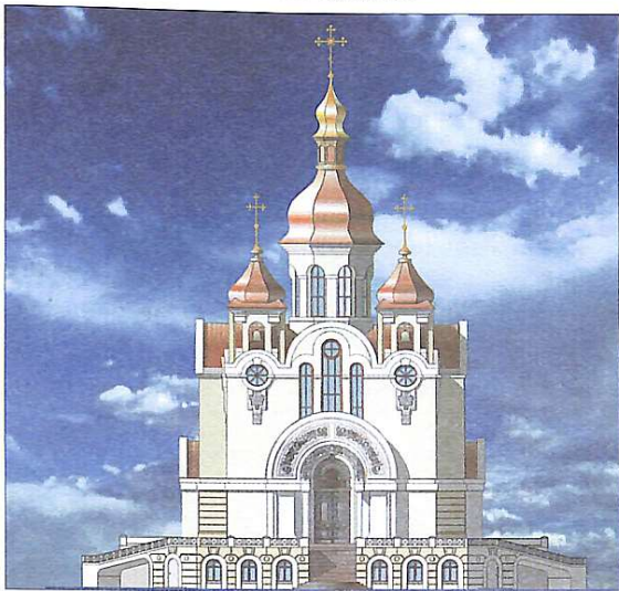
Церква Покрови Святої Богородиці в м. Боярка

виробничого навчання". Завершив дисертацію й успішно захистив у Центральному науково-дослідному і проектному інституті типового і експериментального проектування навчальних закладів (м. Москва).