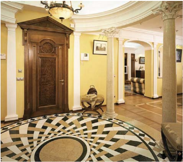
Рис. 2 Покриття підлоги з природного каменя: а-мозаїчні декоративні вставки;