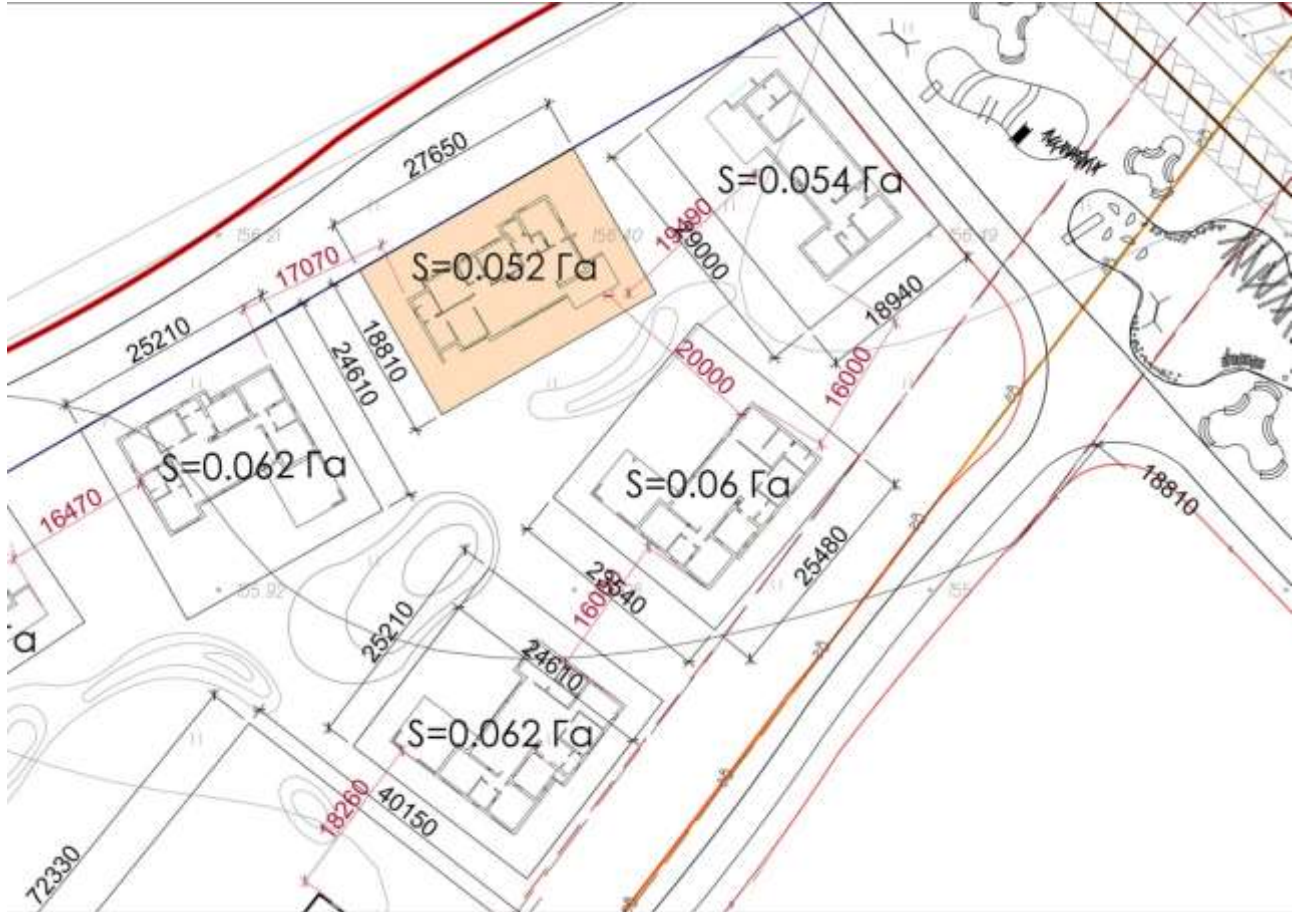
Генплан замських котеджів