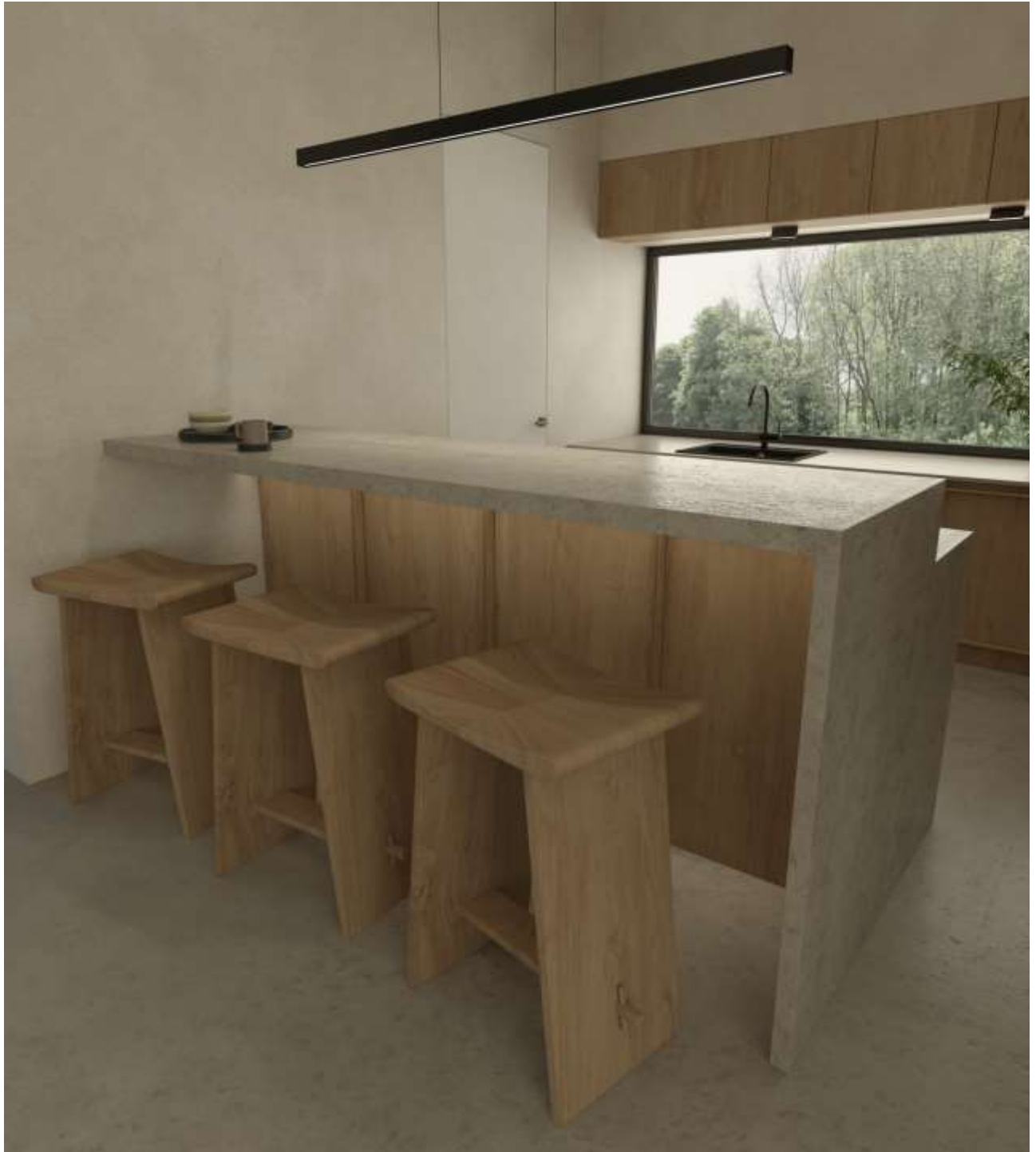
Барна стійка в інтер'єрі