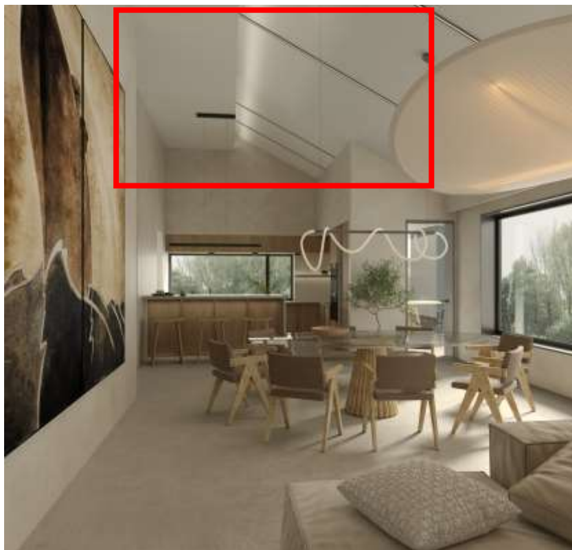
Демонстрація конструкції стелі