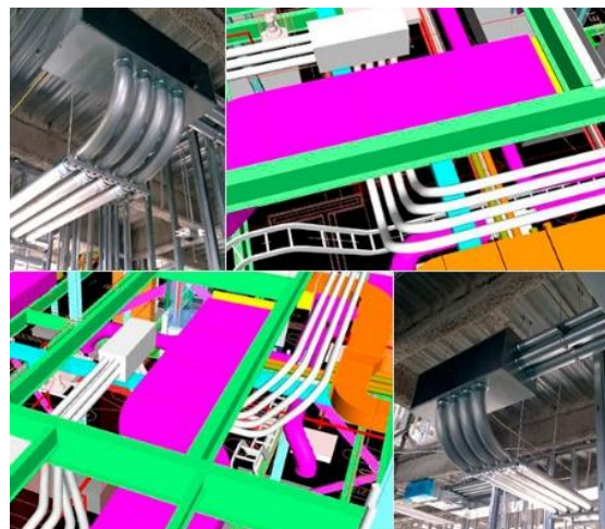
Рисунок 2. Координація між системами в Navisworks

Для координації та виявлення усіх колізій між різними інженерними системами та архітектурними і конструкційними елементами будівлі здебільшого використовують програмне забезпечення Navisworks, що дозволяє уникнути помилок на стадії будівництва (рис. 2).