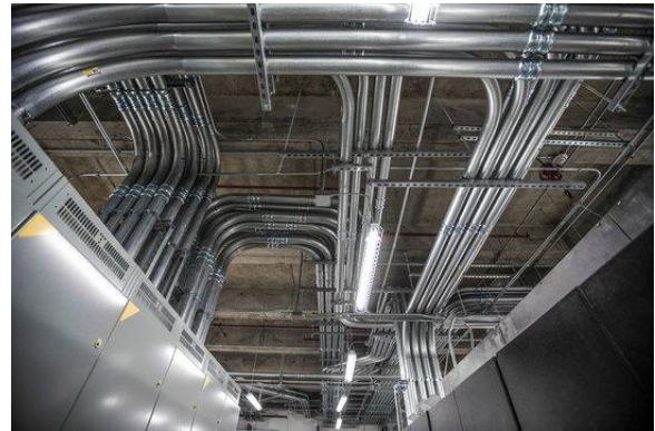
Рисунок 4. Електрична кімната у США

Для прокладання кабелів у США використовують труби, вони ізолюють кабелі від зовнішнього середовища що дає їм захист від фізичного ушкодження, ці труби називають Conduits. У США вони є обов'язковими елементами у багатьох типах будівель, особливо в офісах, заводах, торгових центрах і багатоповерхівках. Такий метод прокладення електропостачання, із застосуванням BIM технологій, забезпечує велику надійність, організованість, значно спрощує монтаж, запобігає додатковим витратам та легко координується з іншими системами.