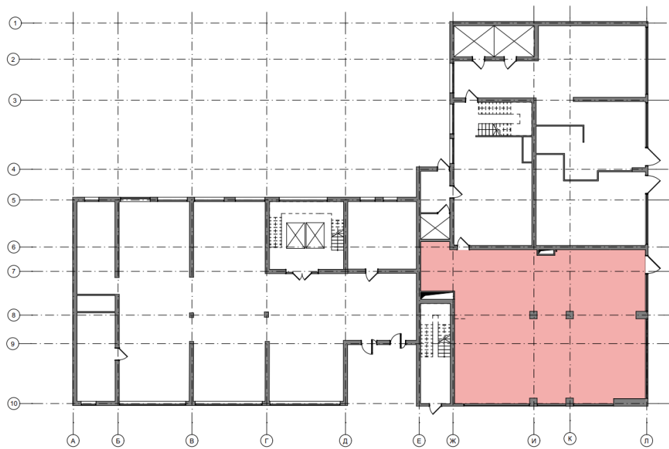
Рис.2.4. План першого поверху та частина простору обраного для розробки

Весь перший поверх займає достатньо велику площу, тому для проектування інтер'єру багатофункціонального простору винного шоуруму було вирішено обрати частину простору загальною площею 205 м 2 .