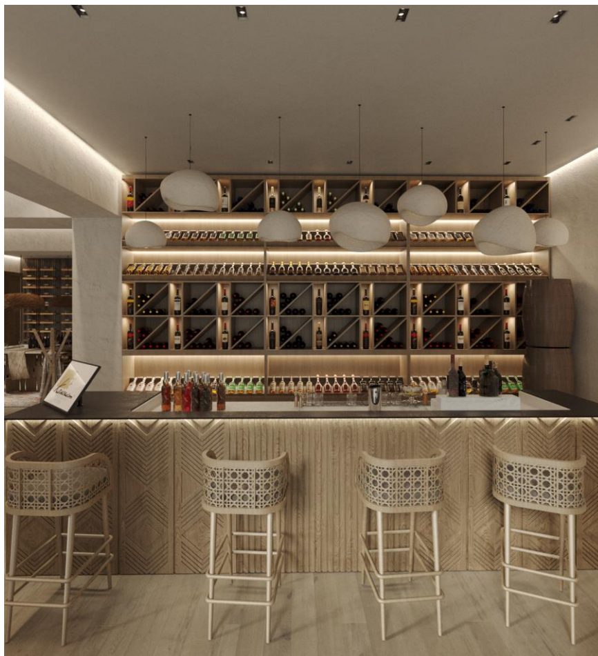
Рис. 2.6. Фрагмент інтер'єру винного шоуруму

Таким чином інтер'єр виглядає неймовірно гармонійним та естетичним, і відвідувачі можуть відчувати елегантність та невимушеність при перебуванні у шоурумі.