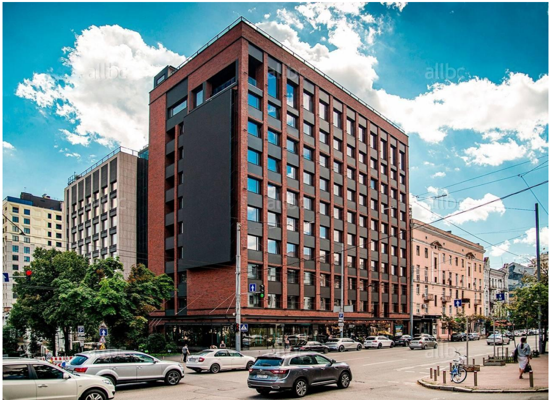
Рис. 2.3. Фасад бізнес центру Infinity Forum