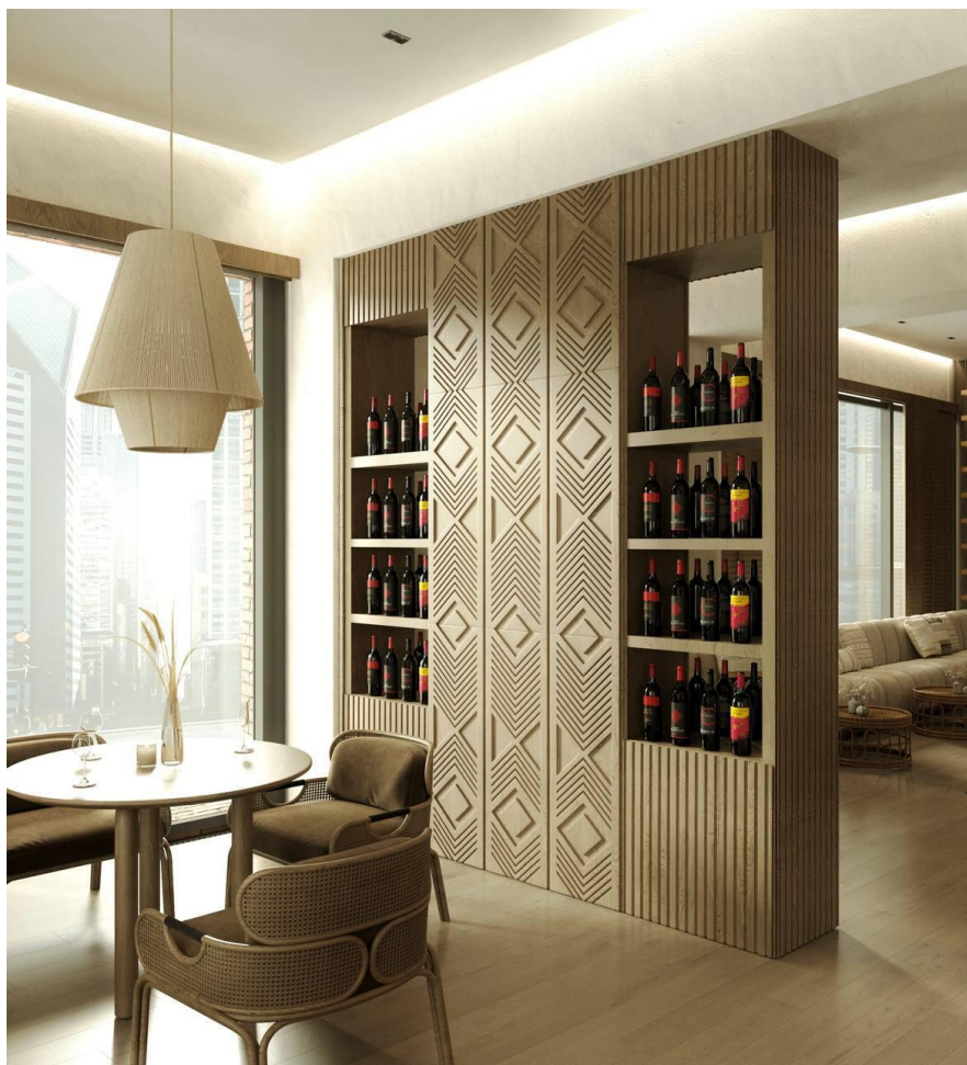
Рис. 3.3. Стенд для вина

Сам стенд виготовлений з натурального матеріалу, що сприяє екологічному настрою інтер'єру. Візуально він ідеально відповідає концепту, вирізьблені центральні елементи, створюють цікаву акценту композицію та нагадують український традиційний орнамент – вишиванку. Бокові елементи з рейок чудово доповнюють цілісну картину та не забирають на себе увагу.