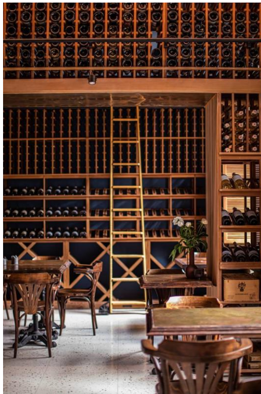
Рис. 3.1. Стенд для вина, ресторан Boca Boca, Київ, Україна

Щоб створити такий елемент меблів мною було проведене дослідження світових аналоїв.