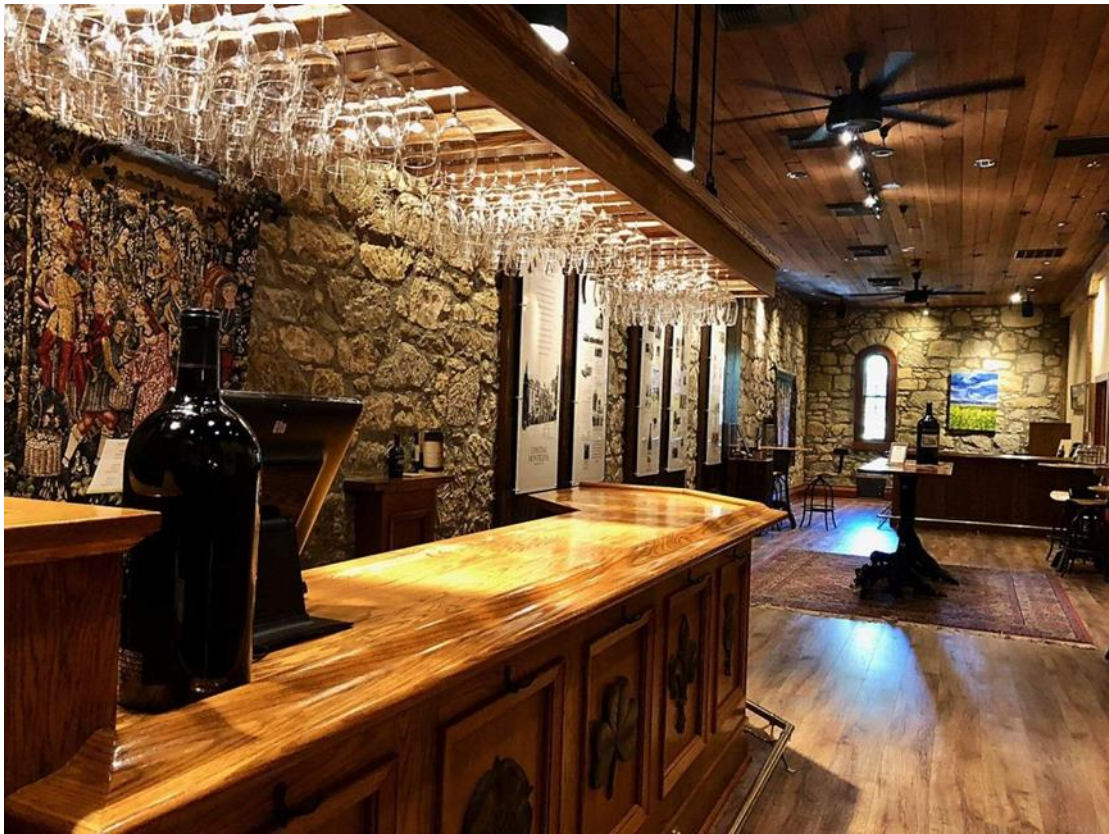
Рис 1.1 та рис.1.2 Chateau Montelena, Каліфорнія, США