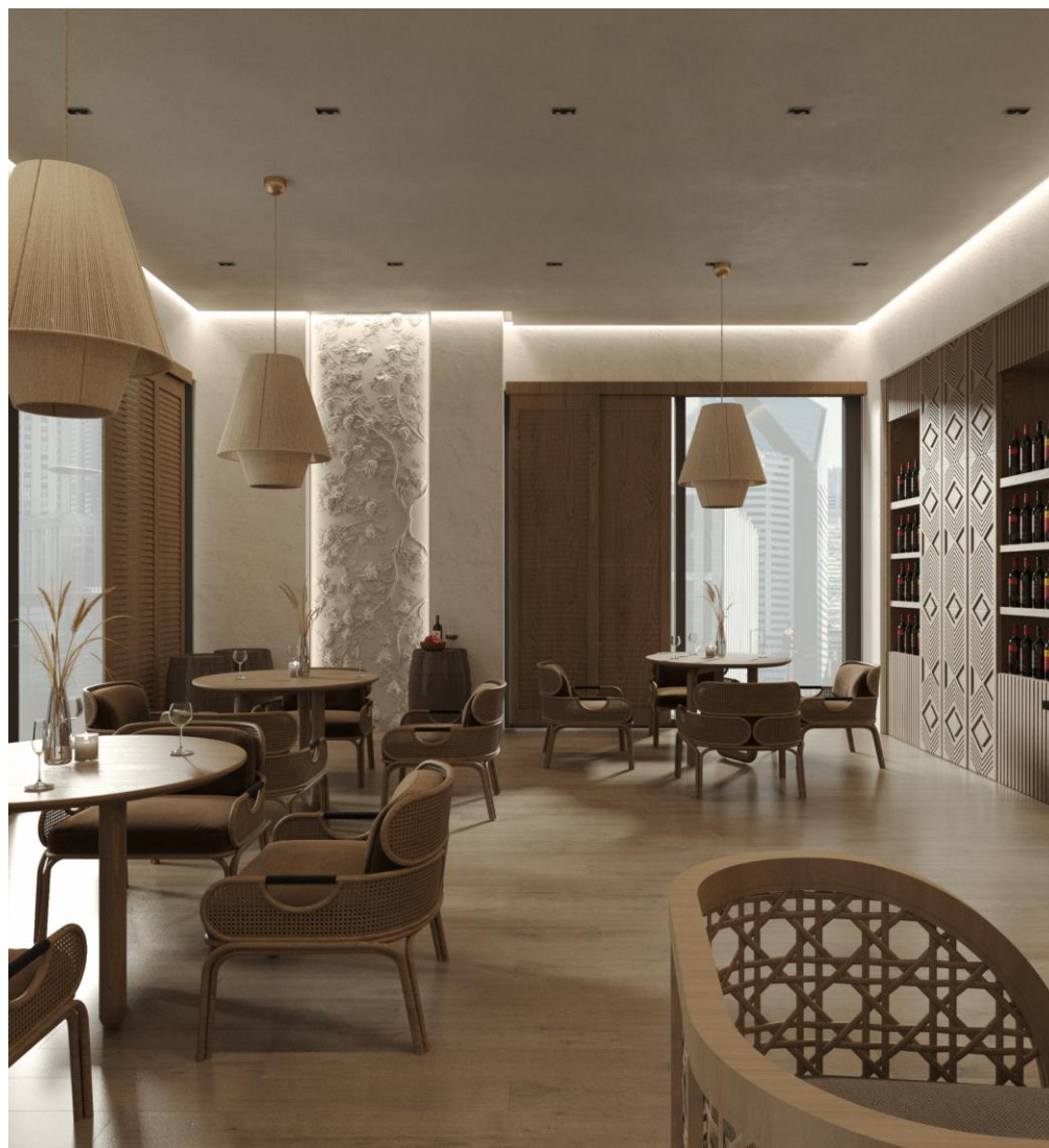
Рис. 2.7. Фрагмент інтер'єру винного шоуруму

бокам конструкції. Основним освітленням в цій зоні є дизайнерські люстри, виконані з природного матеріалу. Зліплені із гіпса вручну ці світильники є чудовим додатком до натуральності та естетичності інтер'єру.