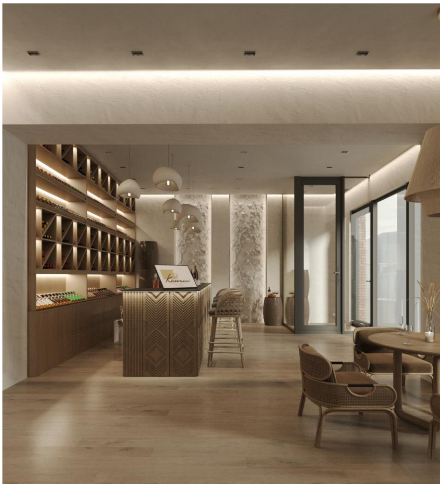
Рис. 2.5. Фрагмент інтер'єру винного шоуруму

Меблі та обладнання інтер'єру виконують дуже важливу роль у створенні гармонійного та цілісного простору. Всі меблі повинні не тільки виконувати свої технічні функції, алей бути естетично привабливими та зручними для всіх відвідувачів простору винного шоуруму. Підбір меблів та створення меблевої композиції вимагає чіткого аналізу всіх факторів та особливостей простору. Щоб досягнути максимальної функціональності приміщення треба дотримуватись ергономічних норм при розстановці меблів, де кожен елемент інтер'єру є зручним, не перешкоджає іншим елементам інтер'єру та не ускладнює пересуванню людини, яка знаходиться в цьому просторі. Лише коли дизайнер враховує всі ці особливості, кінцевий результат меблевої композиції буде зручним, цілісним та естетичним.