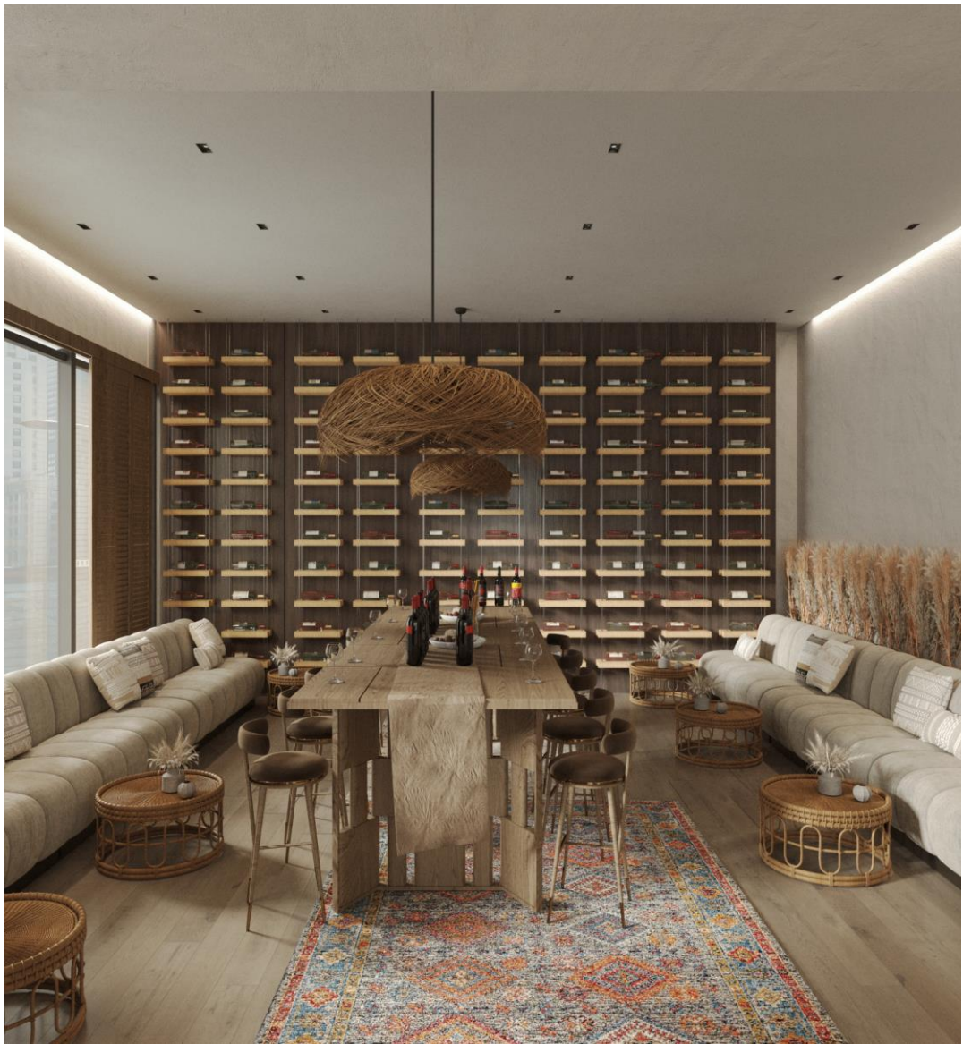
Рис. 2.8. Фрагмент інтер'єру винного шоуруму

Головна зона для лекцій та дегустацій складається зі стола на 10 людей. Весь простір чудово освітлений завдяки великому панорамному вікну на всю стіну. Дерев'яні стільці з м'якою оббивкою додають відчуття комфорту та чудово поєднуються з матеріалом столу, зробленого з натурального дерева. Стіл має масивну, але просту конструкцію, що підкреслює його функціональність і міцність. Він досить великий, щоб комфортно розмістити гостей або слугувати робочим простором для дегустацій. Центральний стіл виконує кілька функцій. Він служить місцем для проведення дегустацій вин, приготування напоїв та закусок, а також може використовуватись для проведення зустрічей чи робочих сесій. Білі довгі дивани розташовані симетрично по бокам від центральної зони дегустації. Зроблені з м'якої