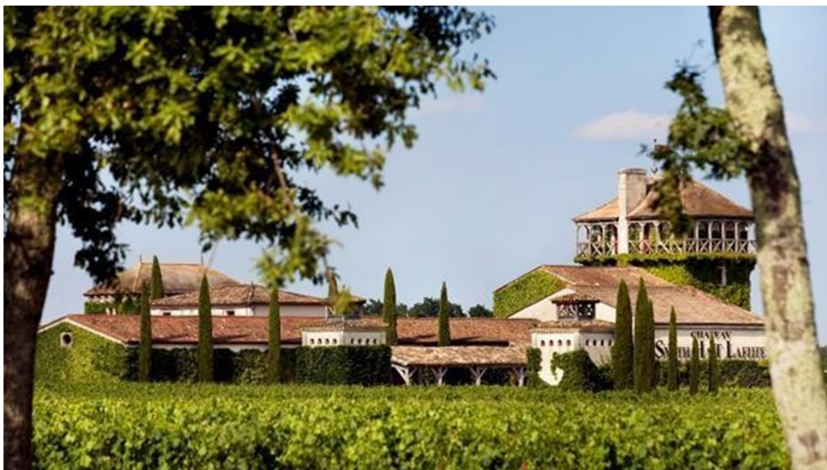
Рис.1.3 Château Smith Haut Lafitte, Бордо, Франція

На території Chateau Montelena регулярно проводяться різноманітні культурні заходи, такі як концерти, мистецькі вистави та винні фестивалі, що додають специфіку та атмосферу цьому винному комплексу. Загалом, Chateau Montelena – це не лише виноробня, але і витвір мистецтва, який об'єднує історію, культуру та виноробство, створюючи незабутні враження для кожного відвідувача.