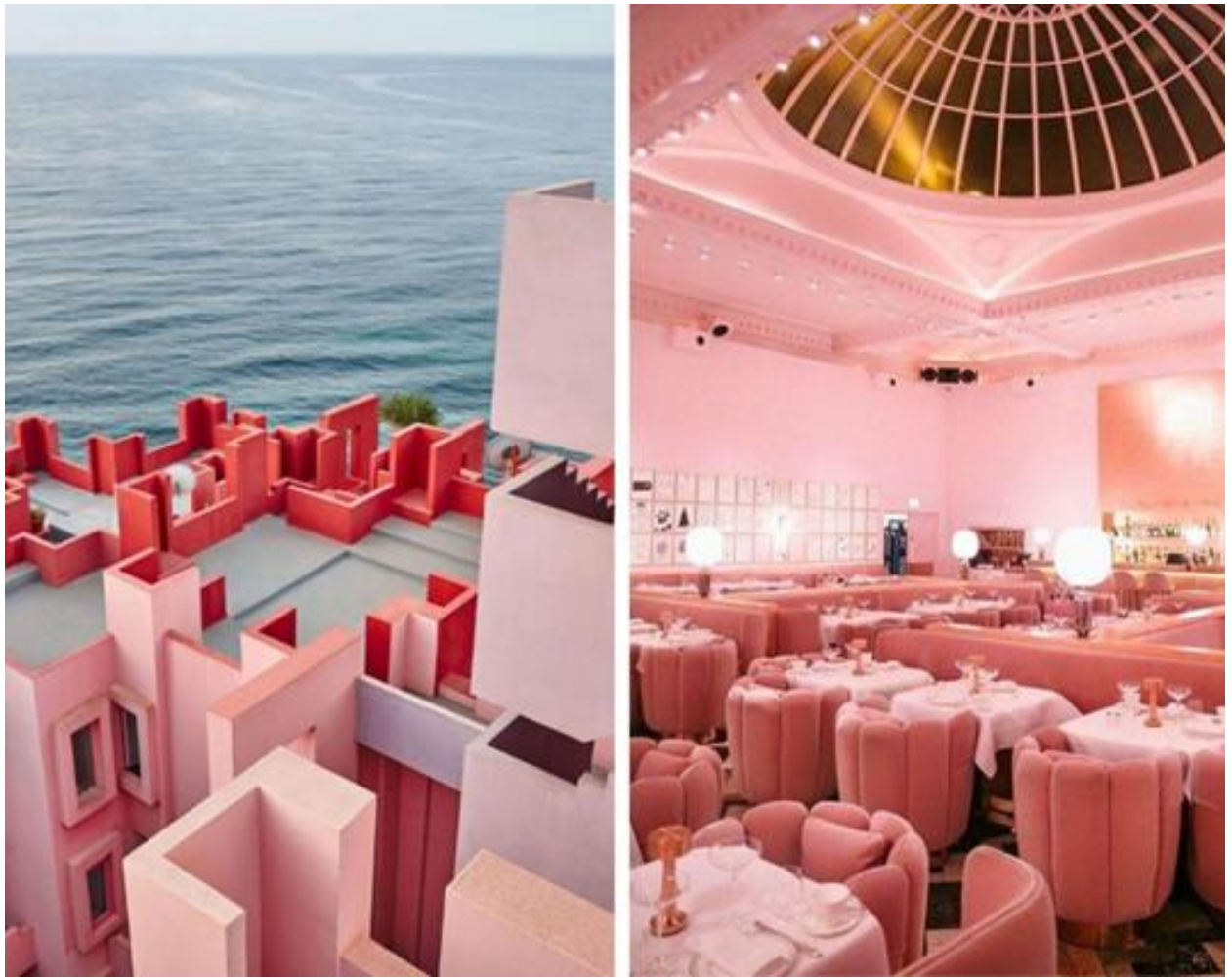
Рис. 1.4 "La Vie en Rose Pavilion": Французкий Шоу-рум Лайфстайлу [ https://www.jaminidesign.com/en/blog/la-vie-en-rose-b92.html ]

La Vie en Rose Pavilion – це унікальний культурно-розважальний комплекс, який поєднує в собі чарівність французької культури, вишукану архітектуру та багатий спектр заходів. Розташований у мальовничому місці, цей павільйон створює атмосферу, де відвідувачі можуть зануритися в неповторний світ французького мистецтва, гастрономії та традицій.