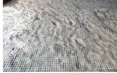
Рисунок 3. Вкладання георешітки

георешіток) забезпечує стабільну роботу земляного полотна, рівномірне осідання основи.