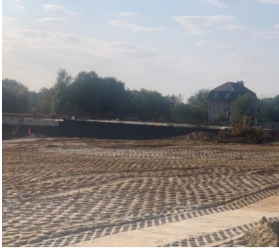
Рисунок 1. Нівелювання площі майданчика

- на підтопленій частині майданчику було виконано дренажну систему [3].