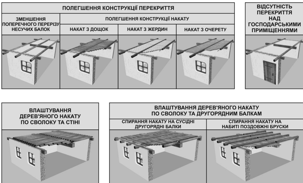
Рис. 3. Особливості влаштування перекриттів (візуалізація тривимірної моделі, виконаної автором)

укладали накат із тесаних широких дощок, який зверху обмазували глиною або глиносоломою. Тобто стеля переважно являла собою горизонтальну поверхню, з площини якої виступали сволок та балки. Проте у степовій смузі України зустрічалися хати, в яких стеля була не горизонтальною, а утворювалася двома скатами, що спиралися на зовнішні стіни і головну балку. На цю ж балку спиралися і кроквяні ноги даху. Можна припустити, що ця конструкція була запозичена з запорізьких землянок, які були відомі ще в XVIII столітті та перекривалися дахом на два скати з невеликим ухилом земляної покрівлі [5]. Проте лише в поліському житлі збереглися поодинокі випадки влаштування таких архаїчних форм стелі, як трикутна, трапецієподібна та напівкругла (горбата стеля) [4].