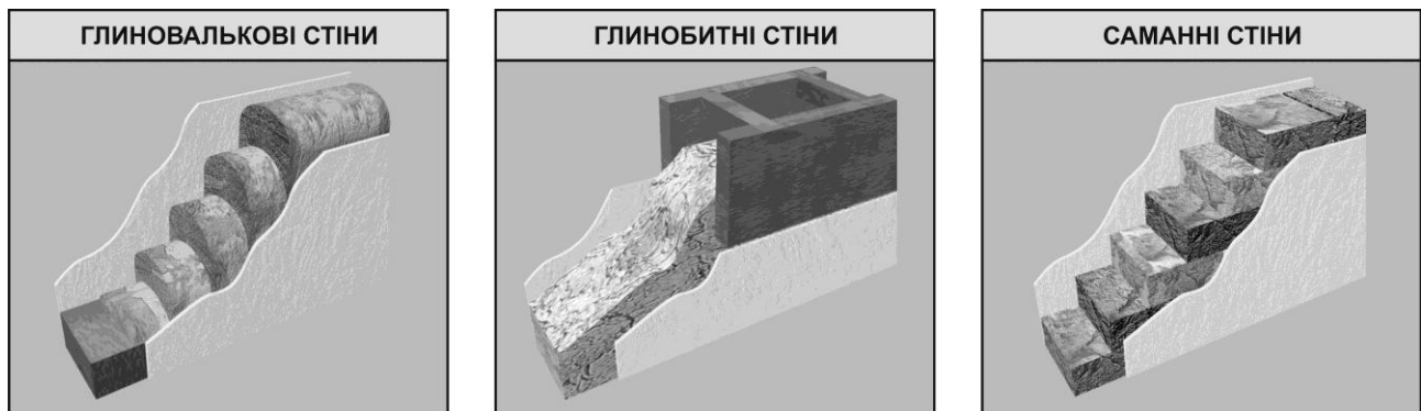
Рис. 2. Особливості безкаркасного вирішення стін (візуалізація тривимірної моделі, виконаної автором)

У північній смузі Лісостепу каркас заповнювали деревом та частково глиносоломою, а у південній – плетінням (мінімально вживали дерево, максимально – лозу, очерет, солом'я з глиносоломою). На Правобережжі відстань між стовпами каркасу (слупами, шулами) заповнювали дерев'яними горбилями (риглями, делями, диликами), які горизонтально закладали в пази (бурти, чари, кані) цих стовпів. У лівобережному варіанті переважав вертикальний спосіб заповнення каркасу (сторчівка, торчівка, всторч). Стіни з плетеним заповненням каркасу (турлучні) мали поширення у зоні Лісостепу та Степу. Вони мали досить легкий каркас із густо поставлених стовпчиків, які скріплювалися кількома рядами горизонтальних жердок (веричок, глиць). Поряд із каркасною у лісостеповій і особливо у степовій частині України побутувала безкаркасна техніка зведення стін із глиносолом'яних вальків та блоків-цеглин (саману, колибу, лампачу, паців), а в ряді районів – із природного каменю – ракушняку, солонцю тощо [4].