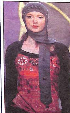
Пропонуємо осінній "пікс" моди – капелюшок з довгими вушами; використовувати їх можна як шафчик