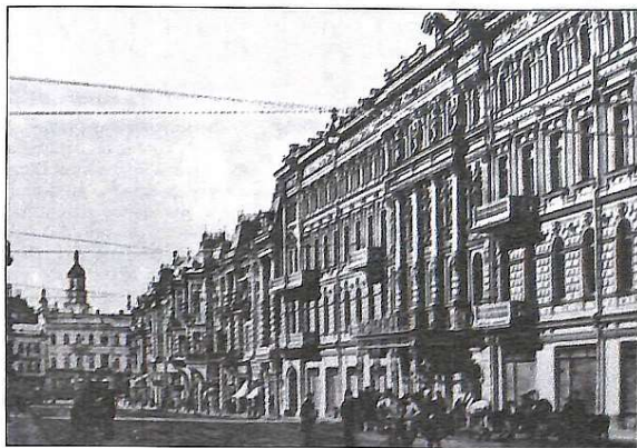
Вулиця Городецького на початку XX століття. Готель "Континенталь"

Дума на початку минулого сторіччя переймалася станом системи водопостачання та якістю питної води, боротьбою із зсувами ґрунту, обслуговування вулиць, встановлювала на них ліхтарі. У центрі застарілі газові та газові (тобто керосинні) ліхтарі замінювали на електричні. А "секонд хенд" переносили туди, де ліхтарів не було ніколи, так само чинили й зі ста-