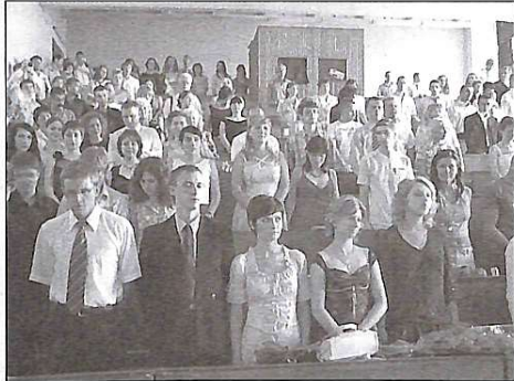
Студенти ГСУТ слухають гімн факультету