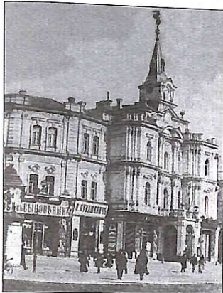
Київська міська дума, 1907 рік

Нові київські мжарочоси з'явилися тому, що архітектори та ті, хто замовляв велику споруду, мали величезне бажання прикрасити рідне місто, зробити більш стильним, подібним до найкращих світових зразків.