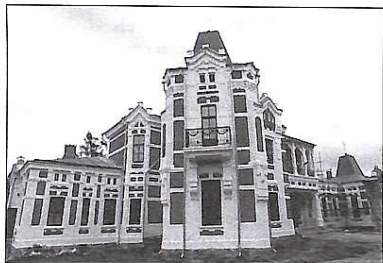
Зовнішній вигляд палацу Хосецьких

Спочатку тут облаштували домову церкву, де розмістили циліндрні ікони, тут знаходяться шановані святині. Так, Намісник