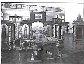
Інтер'єр домашньої церкви