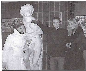
Студенти-архітектори у вестибулі свого навчального корпусу

І на закінчення: за роки своєї діяльності архітектурний факультет дав переконливе свідчення, що він є справжньою Архітектурною школою, визнаною як в Україні, так і за її межами.