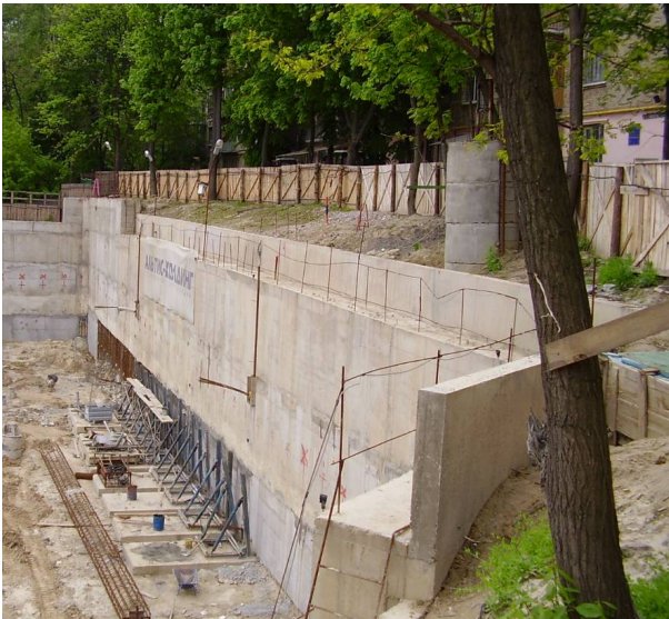
Рис.1. Загальний вигляд влаштування глибокого котловану та підпірної стіни в умовах щільної забудови.

Як приклад розглядається проблема будівництва підпірних стін огорожуючих конструкцій глибоких котлованів в умовах щільної забудови (рис.1). В інженерно-геологічному відношенні ділянка, відведена під будівництво, характеризується досить складними інженерно-геологічними умовами. Це обумовлено наявністю значної потужності насипних ґрунтів з низькими міцнісними показниками, високим рівнем підземних вод, та розташуванням ділянки на схилі.