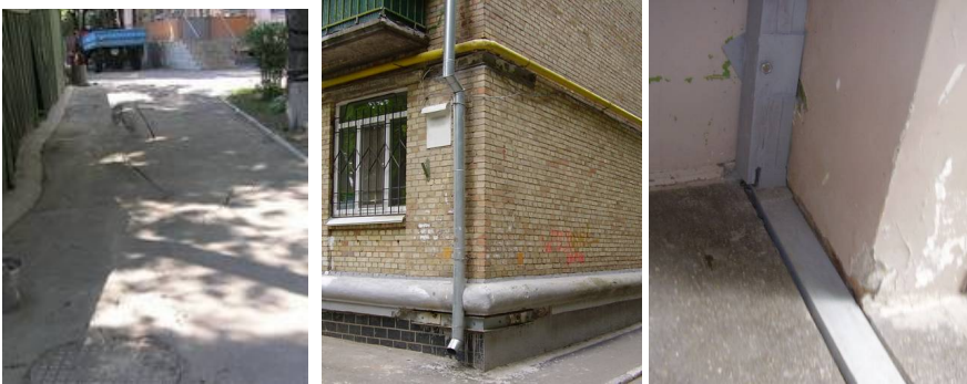
Рис.2. Аварійна ситуація з появою зсувів досить великих об'ємів, і, як наслідок, деформацій будівель і споруд, що розташовані поруч влаштування глибокого котловану та підпірної стіни.

Втім після влаштування глибокого котловану та підпірної стіни виникла аварійна ситуація, яка спричинила появу зсувів досить великих об'ємів, і, як наслідок, деформацій будівель і споруд, що розташовані поруч (рис.2).