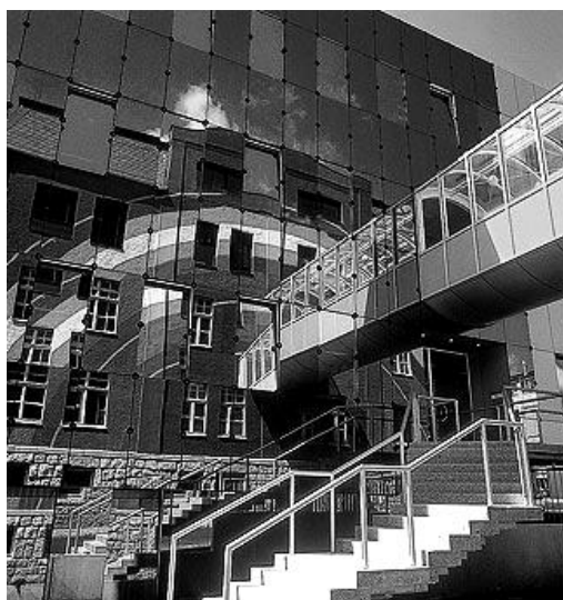
Рис. 4. Фабрика Розенталь, м. Зельб, Німеччина, худ. Ф. Хундертвассер, 1980-1982 рр.

політична активність [5]. Споживачі, що надають перевагу такому типу архітектурного середовища, віднесені до категорії «патетиків», які емоційніше за інших сприймають дійсність. В емоціях вони бачать сенс життя. Їх більше цікавлять елементи оточення, ніж відношення між ними. Представники цього типу відчують неперервність процесів, які розгортаються у докільлі, і віддають перевагу незвичним способам його організації. «Патетики» цінують комфорт і сімейний затишок, піклуються про здоров'я близьких.