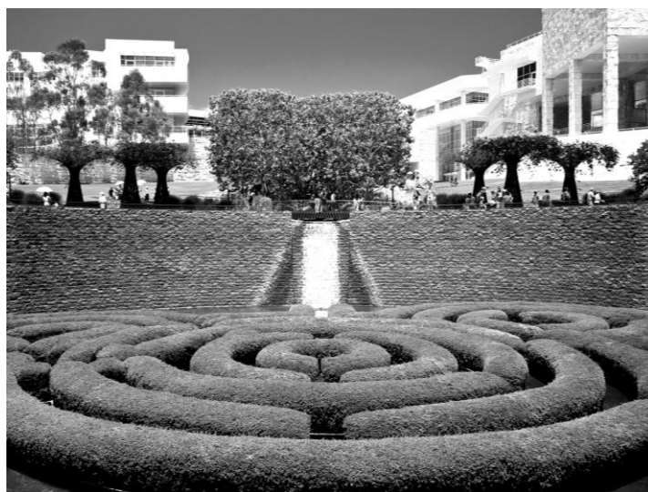
Рис. 5. Центральний сад Гетті Центра, м. Лос-Анжелес, Каліфорнія, США, худ. Р. Ірвін, 1992-1997 рр.

«Патетики», як «містики», «місіонери» і «медіатори», відносяться до етичних типів суб'єктів середовищної діяльності. Їх об'єднує зацікавленість внутрішніми процесами, що розгортаються у докільлі. Причини цих процесів вони схильні пояснювати внутрішніми обставинами. Інформацію, що надходить до них з оточення, представники цих типів пропускають через власні емоційні фільтри. Вони оцінюють ситуацію з точки зору її фактичної відповідності потребам і бажанням людини, а також з точки зору її відповідності певним поведінковим сценаріям.