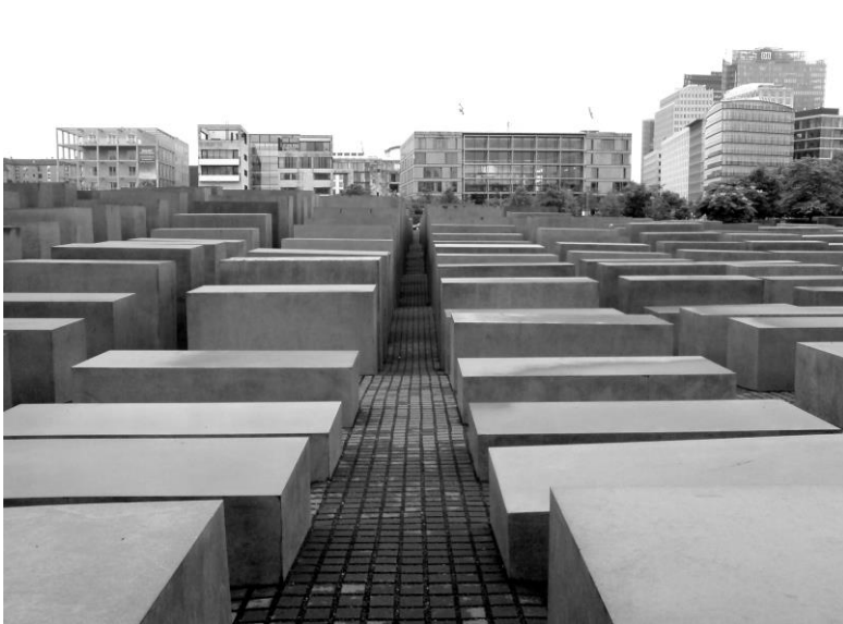
Рис. 2. Меморіал знищеним євреям Європи, м. Берлін, Німеччина, арх. П. Айзенман, 1988-2005 рр.

в 1998–2001 рр. перетворив колишній палац з'їздів нацистської партії архітектора А. Шпеєра, наочно виражає гнів, спрямований на знехтувану ідеологію минулого (рис. 3).