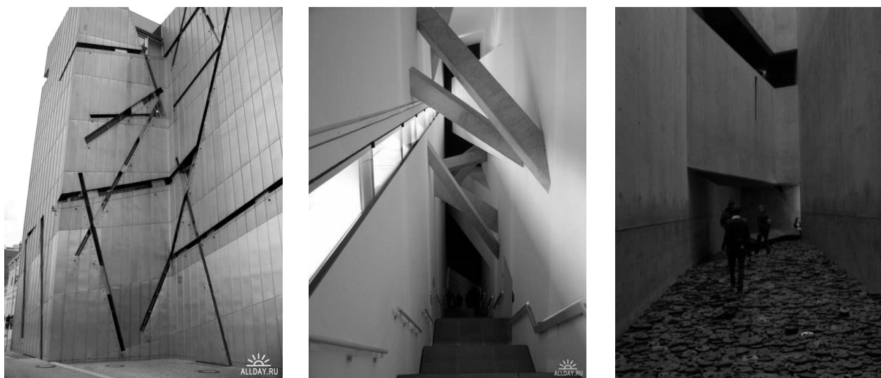
Рис. 1. Єврейський музей, м. Берлін, Німеччина, арх. Д.Лібескінд, 1998-2001 рр.

Відомий психолог К. Ізард виділив десять фундаментальних емоцій (інтерес-хвилювання, радість, подив, горе-страждання, гнів, огида, презирство, страх, сором, провина), які характеризуються специфічними внутрішніми змінами в організмі людини, супроводжуються характерними мимічними або нервово-м'язовими виразними комплексами та відмінними суб'єктивними переживаннями [1]. «Емотивне» архітектурне середовище може провокувати кожен з названих емоційних реакцій, а також безліч інших перехідних і комбінованих. Приміром, відчуття провини мимоволі охоплює відвідувачів Єврейського музею, зведеного в 1998-2001 рр. за проектом архітектора Д. Лібескінда в м. Берліні, Німеччина (рис. 1). Такий ефект створюють і вікна-шрами, що розсікають фасади, і балки-багнети, які пронизують простір центральних сходів, і металеві листки-обличчя, що тужливо і зловісно скреготять під ногами в ущелині порожнього залу ...