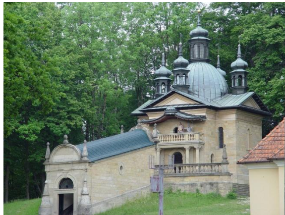
Ryc. 1 a, b. Manierystyczny zespół architektoniczno-krajobrazowy oraz park pielgrzymkowy w Kalwarii Zebrzydowskiej obecnie.

Na terenie Małopolski istnieje także pięć zespołów, które zostały uznane przez Prezydenta RP za pomniki historii. Są to: kopalnia soli w Bochni, ponownie krajobrazowy zespół manierystycznego parku pielgrzymkowego w Kalwarii Zebrzydowskiej, historyczny zespół miasta Krakowa, kopalnia soli w Wieliczce oraz teren historycznej Bitwy Raclawickiej w Raclawicach.