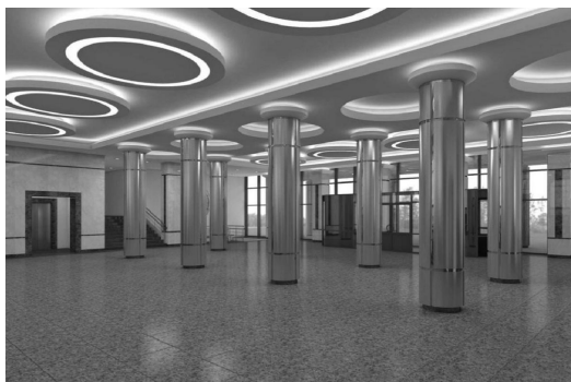
Головний вестибюль КНУБА. Пропозиція.