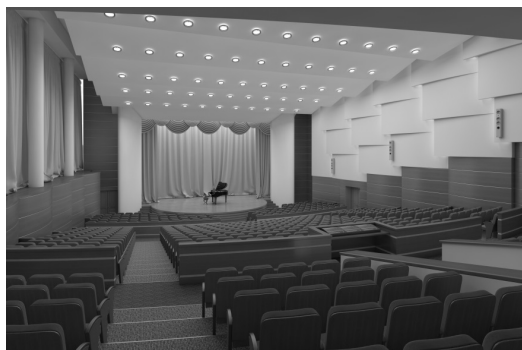
Кіно-концертна зала КНУБА. Реконструкція.. Пропозиція.