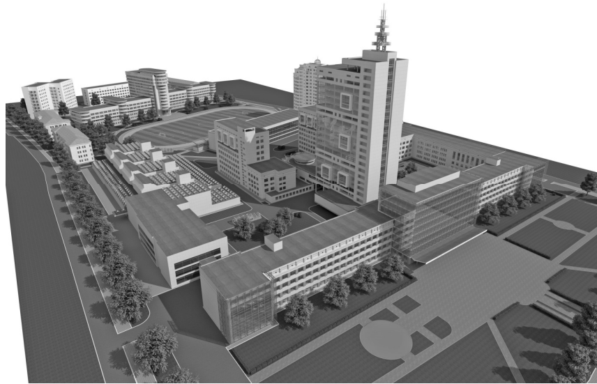
Архітектурно-будівельна концепція розвитку КНУБА. Загальний вигляд.

Архітектурно-будівельна концепція розвитку університету передбачає часткову реконструкцію існуючих будівель і окремих приміщень у них, розширення площ навчальних та житлових будівель університету шляхом зведення додаткових корпусів, надбудов та прибудов до існуючих, підземних та наземних паркінгів у вищезгаданих зонах. Єдність стилю комплексу досягається взаємозв'язком факторів, що визначають архітектурний простір – функції, матеріалу, художнього змісту і форми