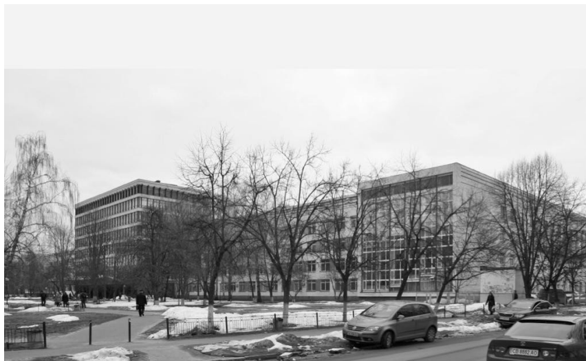
Будівля по просп. Повітрофлотський, 31. Існуючий стан.

Нагальні потреби життя вимагають збільшення набору студентів і розширення визнання ВНЗ в світі, а це неможливо без модернізації і всього навчального процесу й архітектури будівель, сучасного вирішення навчальних корпусів. Шляхи модернізації комплексу будівель Київського