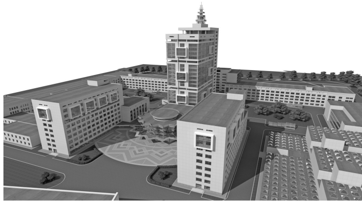
Реконструкція простору учбової зони КНУБА. Пропозиція.