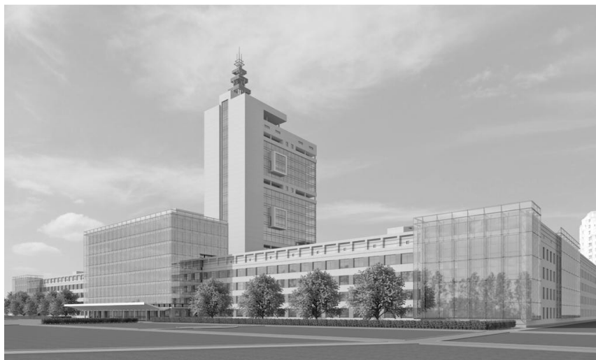
Головний учбовий корпус КНУБА. Реконструкція. Загальний вигляд. Пропозиція.