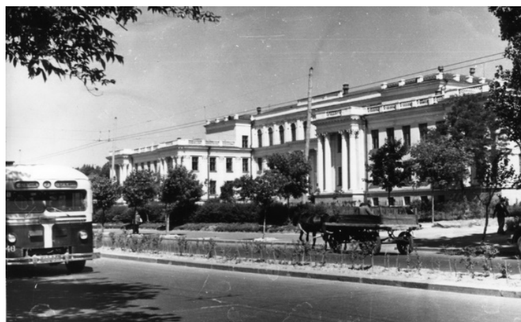
Будівля по просп. Перемоги, 10