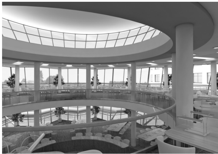
Читальна зала бібліотеки КНУБА. Третій поверх. Пропозиція.