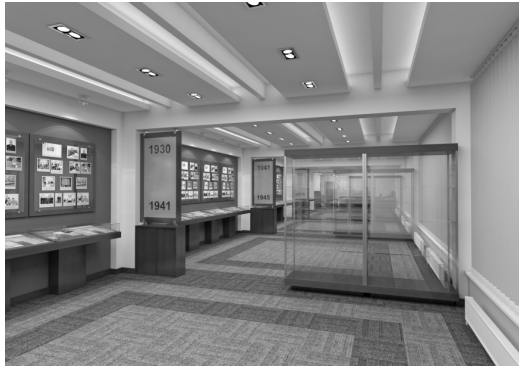
Музей КНУБА. Реконструкція. Третій поверх. Пропозиція

Запропонована архітектурно-будівельна концепція розвитку Київського національного університету будівництва і архітектури дозволить підвищити статус КНУБА на загальнодержавному та міжнародному рівнях як головного ВУЗ України архітектурно-будівельного напрямку; привести рівень