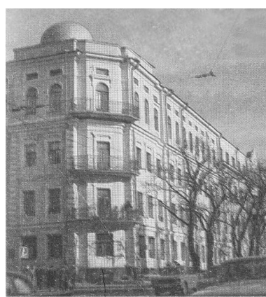
Будівля по бульв. Шевченка, 22-24