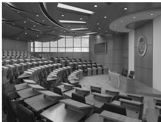
Зала Вченої ради КНУБА. Пропозиція