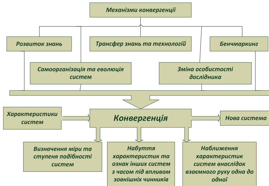
Рисунок 1 – Механізми та методи конвергенції систем