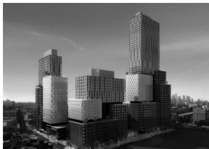
Рис. 3. Atlantic Yards, Бруклін, Нью-Йорк.