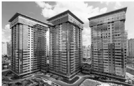
Рис. 13. Riverstone м. Київ. Дніпровська набережна, 14

Отже, підіб'ємо підсумок, у композиції сучасної багатоповерхової архітектури можемо виділити три основні принципи: принцип розділення, протиставлення та переходу. Кожен принцип об'єднує в собі групу тенденцій, що мають схожі композиційні прийоми.