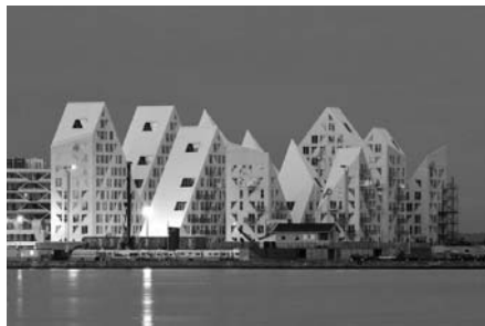
Рис. 7. The Iceberg. Данія