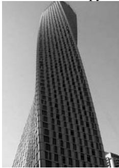
Рис. 11. Cayan Tower (Infinity Tower), ОАЕ.

Окремим пунктом виділимо ще одну тенденцію, характерну для української багатоповерхової житлової архітектури. Вітчизняна житлова архітектура повертається до тричасності загальної композиції об'єму. Складається зі стилобату, основної частини будівлі та завершення (рис. 13). Для актуальної житлової зарубіжної архітектури не характерна тенденція.