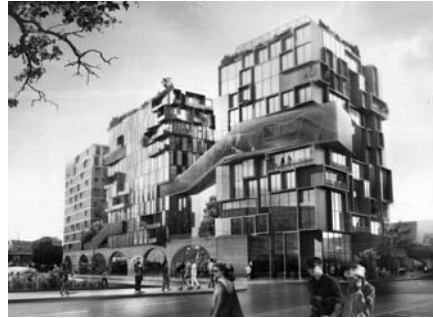
Рис.6. Житловий будинок. Берлін.