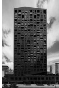
Рис. 5. Magma Towers. Монтерей, Мексика.

Використання цього принципу дає можливість чітко позиціонувати будівлю стилістично, надавати їй вигляду, що відповідає загальносвітовим архітектурним тенденціям.