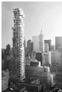
Рис. 9. 56 Leonard Street. Нью-Йорк.