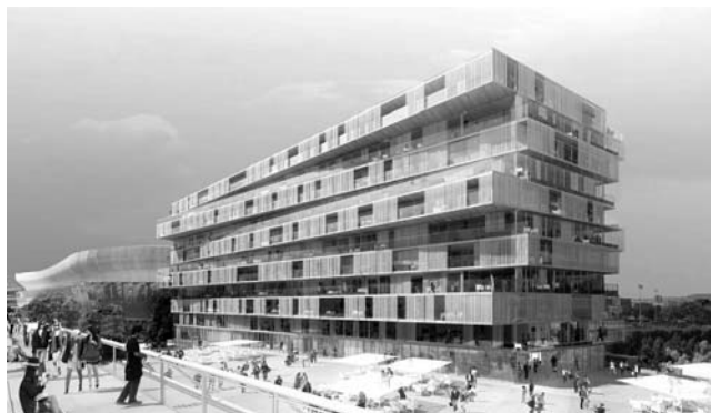
Рис. 1. Житловий комплекс. Париж.