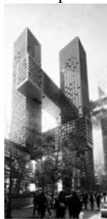
Рис. 10. Cross # Towers. Сеул, Південна Корея.

Особливу увагу треба приділити ще двом композиційним прийомам, які є найбільш зрозумілими та легко розпізнаваними, ці прийоми є яскравою ознакою сучасної актуальної архітектури.