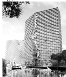
Рис. 4. Marina Lofts. Форт Лаундердейл, США.