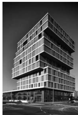
Рис. 2. Житловий будинок. Словенія.