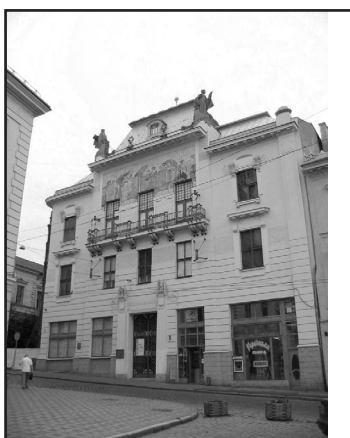
Фото 11. Загальний вигляд архітектурного декору центрального фасаду колишньої Дирекції Буковинської Ощадної каси у стилі віденської сецесії (нині Чернівецького обласного Художнього музею), збудованої за проектом віденського арх.Г.Гесснера 2006р.