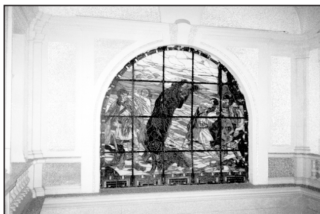
Фото 10. Збережений вітраж у виконанні відомого випускника Віденської Академії мистецтв: архітектора-декоратора Альфреда Оффнера, створений 1908р. у парадному фойє колишнього Крайового управління Буковини (нині учбовий корпус історичного факультету Чернівецького національного університету ім.Ю.Федьковича), збудованого у стилі неокласицизму. Світлина авторки. 2008р.