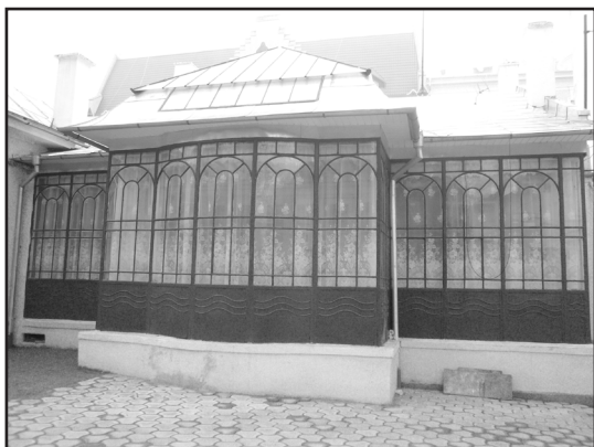
Фото 7. Металодекор у стилі модерн в оздобленні прибудованої веранди до колишнього приватного особняка кінця XIX ст. (нині дитячої установи) по вул.О.Кобилянської, 40 у Чернівцях. 2010р.