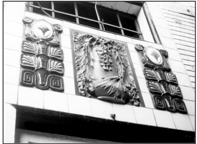
Фото 2. Фрагмент рекламного керамічного декору колишньої майстерні-ательє чернівецького майстра-декоратора Леона Шренцеля (Leon Schrenzel) по вул.28 Червня, буд.2. 2016р.