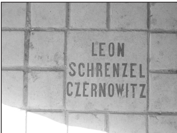
Фото 3. Декоративна керамічна плитка з майстерні Леона Шренцеля у Чернівцях. У парадних багатьох історичних будівель міста збережена декоративна аутентична керамічна плитка одного з перших майстрів-керамістів міста Леона Шренцеля. 2007р.