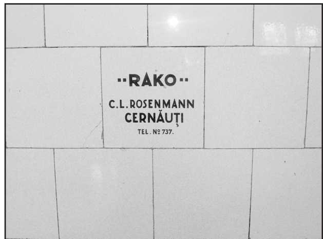
Фото 4. Взірець облицювальної керамічної плитки 1930-х років чернівецького майстра-облицювальника Розенмана (С.L.Rosenmann), збережений в одному з інтер'єрів житлових помешкань історичної забудови «румунського періоду». 2010р.