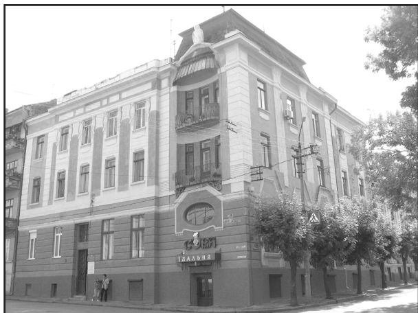
Фото 12. Загальний вигляд архітектурного декору фасадів колишнього Дому Співки медиків Буковини (нині багатоквартирного житлового будинку), збудованого 1907р. за проектом арх. Р.Фітека. 2007р.