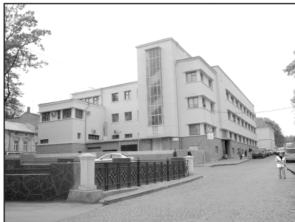
Фото 13. Архітектурний декор фасадів адміністративної будівлі колишнього страхового управління Буковини (нині міської поліклініки) у стилі європейського функціоналізму, збудованої у 1930-х роках на розі вул.Шкільної, 8 – Турецької, 9.