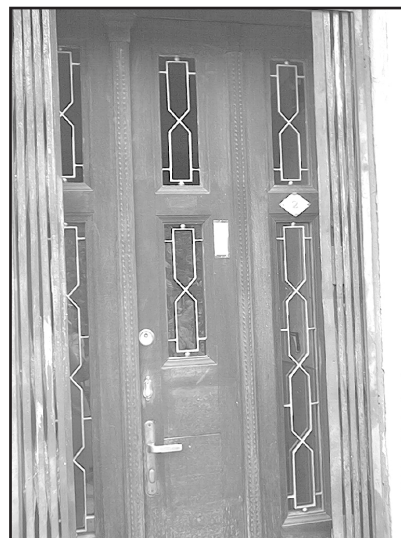
Фото 6. Вхідні двері до приватної квартири, виконані у стилі європейського ар деко в одному з особняків 1930-х років по вул.Т.Шевченка у Чернівцях. 2005р.