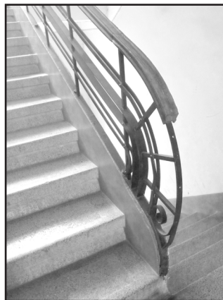
Фото 14-15. Фрагменти архітектурного декору парадної одного з житлових прибуткових будинків 1930-х років у стилі європейського ар деко в районі вул.В. Сімовича. Іноді трапляються взірці, в декорі яких методом бачардування викарбовані заклики румунською мовою до мешканців: «Витирайте, будь-ласка ноги!» 2015 р.