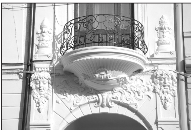
Фото 5. Фрагмент балкону прибуткового будинку, оздобленого маскаронами та металодекором у стилі модерн по вул. Лисенка, 4 у Чернівцях. 2007 р.