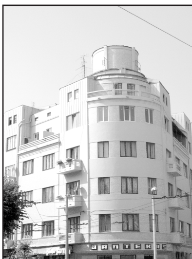
Фото 16. Архітектурний декор багатоквартирного прибуткового житлового «будинку-корабля» 1930-х рр. на розі вул.Університетської, 12-28 Червня, 1. 2015р.