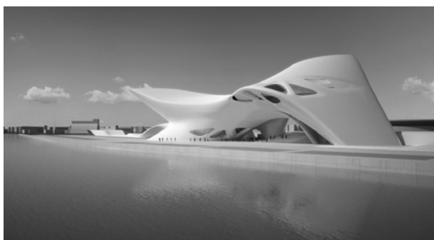
Рис.1. Nuragic and Contemporary Art Musum. Архітектор - Zaha HadidZ

В умовах сучасної ринкової економіки особливо актуальна в галузі капітального будівництва тематика застосування ефективних будівельних матеріалів та конструкцій в будівлях і спорудах. В останні роки в будівництві громадських, промислових та сільськогосподарських споруд все частіше виникають завдання по розробці проблем теорії споруд. Все це пов'язано з великою технізованістю ХХІ сторіччя. Стрімкий розвиток технічного прогресу має вплив на всі галузі, в тому ж числі на архітектуру та будівництво. Виходячи з фактичного стану ХХІ століття, динамічність життя суспільства, пов'язана з неймовірними темпами науково-технічного прогресу, розширенням меж діяльності суспільства, посиленням міграції та рухомості населення, що сприяє змінам у всіх сферах людської діяльності, в тому числі в архітектурі, як матеріальному середовищі цієї діяльності.