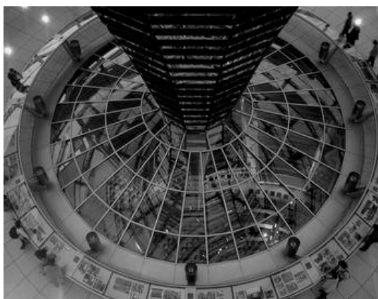
Рис. 5. Сучасний вигляд куполу над Рейхстагом

Щодо зміни функції існують інші найрізноманітніші випадки. Зокрема організація в межах культових споруд культурного центру (будівля монастиря святого Франциска 1721 -1729 роки будівництва, Сенпедор, Іспанія); книжкового магазину (Домініканський собор (1294 р.), Нідерланди); приватного житла в будівлі колишньої церкви в Ноттінгхемі, в Лондоні і, навіть, спортивного клубу в Монреалі, штат Квебек, Канада.