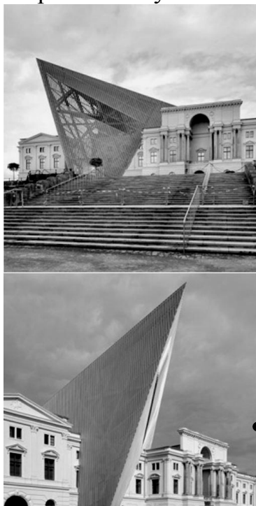
Рис.3. Військово-історичний музей в Дрездені.

Крім того архітектура міста має завжди залишатись динамічною і поєднувати в собі об'єкти та нашарування різних періодів історії, включаючи сучасний. Існування у містах індивідуальних пізнавальних рис народжує феномен культури конкретного міста і дозволяє регенерувати тканину без утворення «штучних операційних рубців».