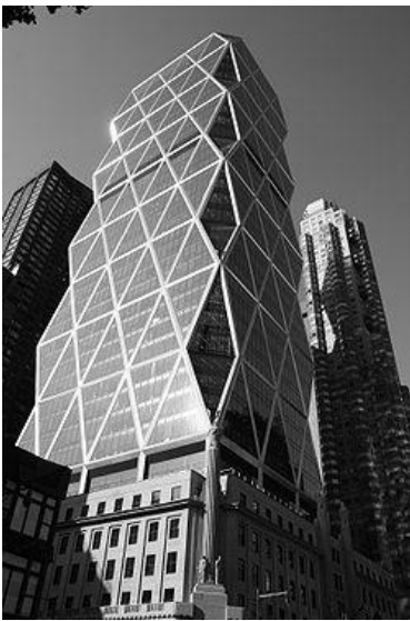
Рис. 4. Н. Фостер. Херст Тауер

Зміна функціонального призначення. Не дивлячись на цілковиту можливість зміни функції, яка продиктована видом реконструкції, коли зберігається лише фасадна частина, а отже існує можливість кардинальної зміни конструктивної системи та присвоєння функцій, які вписуються в великопроботні простори, в спорудах, що реконструюються на території України, за невеликим виключенням, ця можливість не використовується. Навпаки, майже завжди прослідковується функціональна спадковість, що значно знижує вартісні показники ділянки реконструкції та експлуатаційні можливості споруди.