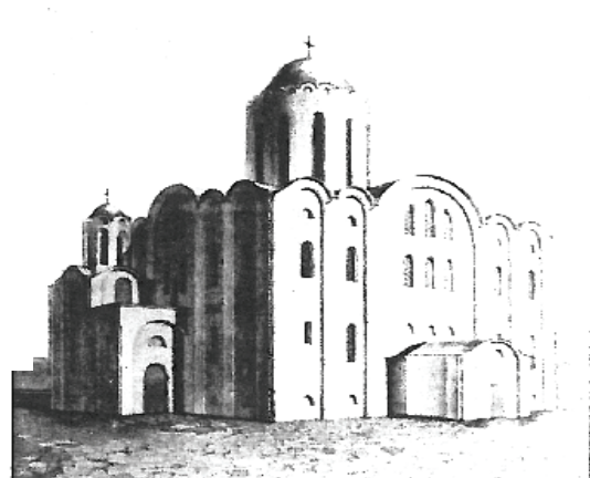
Переяслав. Михайлівський собор, XI ст. Реконструкція Ю. Акєєва

Місто складалося з двох укріплених частин, розташованих на мисі при впадінні ріки Альти в Трубіж (іл. 1). У Дитинці площею близько 12 га у 10-11 ст. розташовувалися двори-хороми князів, дружинників і духовенством. На північ від Дитинця розбудовується окольне місто, яке також було укріплено міцними городнями. Троє воріт вели з окольного міста у передмістя та на головні шляхи. У центрі окольного міста була головна площа і торг, від яких на чотири боки відходили дороги до воріт.