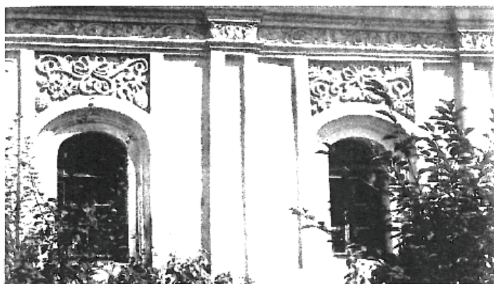
Переяслав. Михайлівська церква, 1654 р. Сучасний вигляд