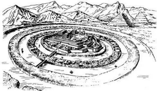
Мал.2. Ідеальне місто за Платоном

Розробляли ідеї ідеальних міст і архітектори Італії. Серед них Філарете(Мал.3.) ( бл. 1400 — 1467 )У своєму «Трактаті про архітектуру» він описує два ідеальні міста - Плузіяполіс та Сфорцинду.