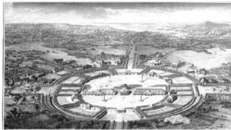
Мал.4. Ідеальне промислове місто Клода-Нікола Леду

Такими були найяскравіші приклади ідеальних міст-утопій. Ці міста або проекти в людській уяві дають нам можливість казати про те що людина це соціальна істота, яка реалізує себе в соціальних відносинах. Ми бачимо, що всі основні трудові вузли цих міст тяжіють до адміністративних центрів. Відокремлюючи місце праці та житлове середовище, міські жителі вже у той час створювали трудові зв'язки. Як бачимо, навколишнє середовище, образ і організм міста мали взаємний вплив один на одного. Просторове формування міст завжди було під впливом передусім природних умов, економічних можливостей, функціональних та соціальних потреб та творчих здібностей людей.