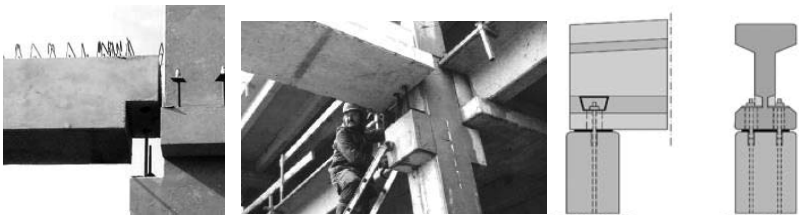
Рис. 2. Варіанти спирання балок на колони

Номенклатура лінійних горизонтальних конструкцій (балок) ( f_2 ) більш різноманітна (рис. 2). Випускаються балки прямокутного перерізу, таврові, двотаврові. Ширина 300 ... 1200 мм, висота 400 ... 1600 мм і довжина до 30 м. Стикові з'єднання на консолях колон комбінованого типу ( d_1 \cup d_2 ), а на оголовках колон болтового типу ( d_1 ).