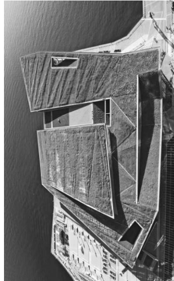
Конференц-центр Ванкувера, Канада