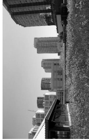
Торгівельний центр, Торонто, Канада