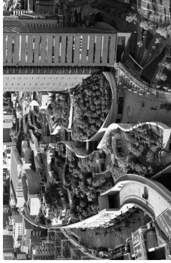
Торгівельний центр, Осака, Японія