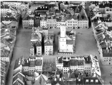
Рис. 3. План розпланування площі Ринок станом на поч. XX ст.

3- Власник за списками податків 1767 (ЦДІАЛ Ф-52 Оп-1 Сп-770; 777;783;812);