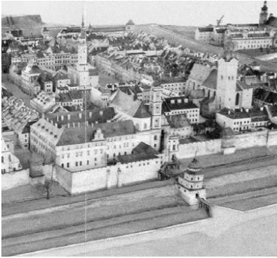
Рис. 1. Єзуїтська хвіртка на макеті Я. Вітвіцького 30-ті рр.. XX ст. [1].

кільцевих бульварів на їх місці, у Львові було проведено в період, з 1777 по 1835 рік. У Відні подібні заходи почали реалізовуватися лише, починаючи від 1857 р., у містах Будапешті та Празі після 1870 р.. Центр міста із площі Ринок поступово перемістився на новозакладене бульварне кільце, яке майже по всьому периметру охоплювало старе середньовічне місто, лише зі сходу оборонні мури простояли до середини XIX століття (початок демонтажних робіт припадає на 1820 рік).