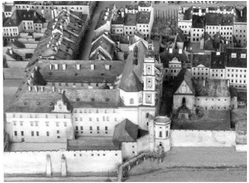
Рис. 2. Старе розпланування площі Ринок на Макеті Я. Вітвіцького 30-ті рр.. XX ст. [1].

Зі старих міських укріплень лише вдалось вціліти Пороховій вежі, яка стояла осторонь і далі служила як порохівниця, тобто складом зброї, залишкам Римарської вежі комплексу Домініканів та Малярської вежі, вежі цеху Токарів, Руської вежі, споруди Королівського та Міського арсеналів і східна частина високого муру. Зміни торкнулися також і головної водної артерії Львова – річки Полтви, що протікає із західного боку середмістя, де на першому етапі були споруджені три мости. На другому етапі почалось замурування ріки Полтви [7]. До 1840 року проіснував останній на сучасному проспекті Свободи міст навпроти нинішнього готелю «George». Аналізуючи архітектурні і містобудівні перевтілення у сформованому історичному ядрі як окремі послідовні та закономірні для свого часу явища можна виділити основні напрямки проектних робіт, які проводились наприкінці XIX ст. у Львові: