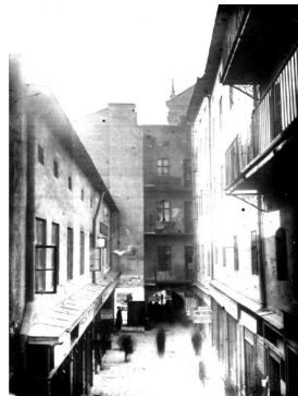
Рис. 4. Архівне фото пасажу Андреоллі 30-ті рр..

Важливий містобудівний документ був прийнятий міською владою у 1891 році, видана постанова про регулювання забудови у центральній частині міста [4]. Постанова була спрямована, у першу чергу, на покращення транспортного сполучення в кам'яниць, таким чином створити нові вулиці, які мали б набагато ширші параметри самої вуличної мережі. Основні реконструктивні роботи у середмісті передбачали наступні дії: