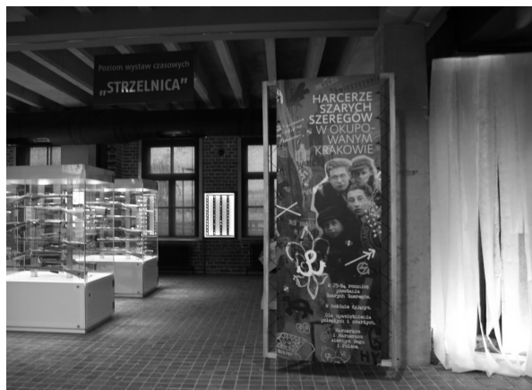
Rys.4. Wystawa czasowa „Strzelnica” w Muzeum AK w Krakowie (Autorzy: D. Kuśnierz-Krupa, J. Kobylarczyk, K. Paprzyca)