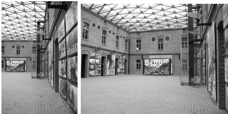
Rys.2. Przeszkłone zadaszenie wewnętrznego dziedzińca Muzeum AK w Krakowie (Autorzy: D. Kuśnierz-Krupa, J. Kobylarczyk, K. Paprzyca) Rys.3. Ekspozycja w wewnętrznym dziedzińcu Muzeum AK w Krakowie (Autorzy: D. Kuśnierz-Krupa, J. Kobylarczyk, K. Paprzyca)

Sam powojkowy obiekt – nowa siedziba Muzeum uległ modernizacji trwającej od 2009r. do 2011 r. Projekt rewaloryzacji oraz całej adaptacji został wykonany przez pracownię AIR Jurkowsy Architekci. Fasadę poddano renowacji poprzez oczyszczenie cegieł, wymianę stolarek okiennych oraz przebudowanie wnętrza Muzeum. Największą ingerencją było zadaszenie całego dziedzińca. Nowy budynek Muzeum został nagrodzony w konkursie Brick Award; był też nominowany do Mies van der Rohe Award oraz wyróżniony w Konkursie SARP na najlepszy obiekt architektoniczny w Polsce 2011 roku 12 .