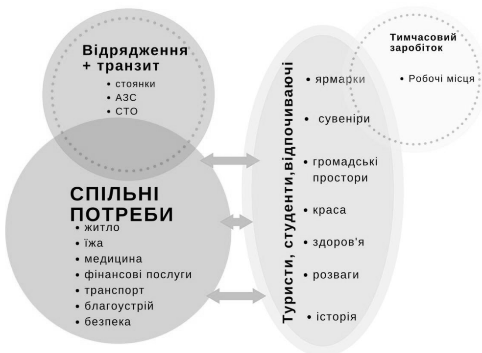
Рис.3 Функція потреб нерезидентів-фізичних осіб

Фінансовий та бюджетний аналіз міста на основі розрахунку показників фінансової та бюджетної ємності дозволив дати відповідь на питання: