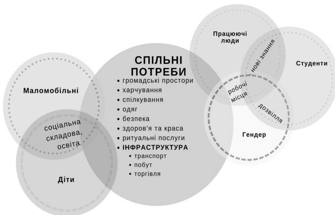
Рис.2 Функція потреб резидентів-фізичних осіб