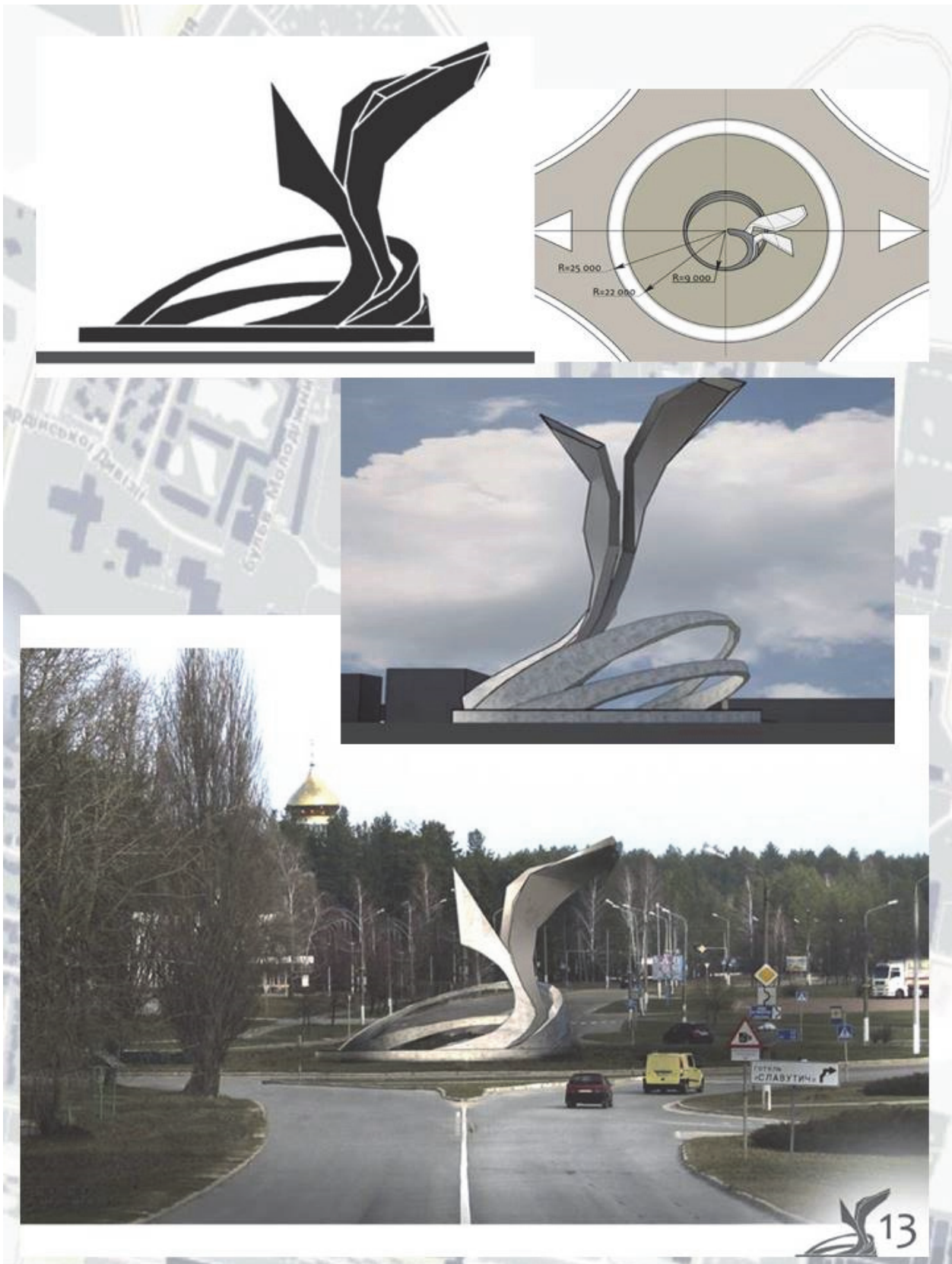
Рис.4 Конкурсний проект пам'ятного знаку-символу у м. Славутич. Автор: студентка КНУБА кафедри ОА і АП гр. 54-а Кожевнікова А.В.