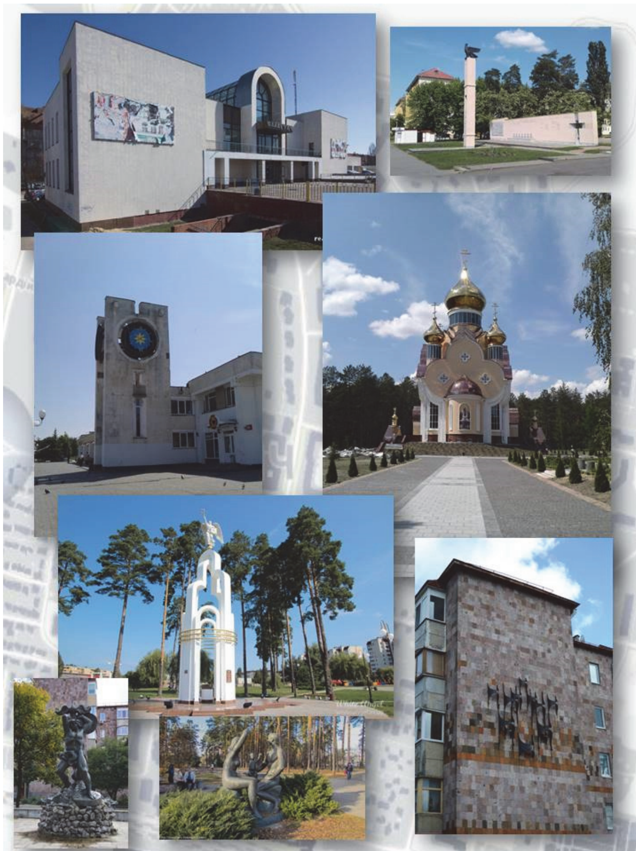
Рис. 2 Фрагменти міського середовища міста Славутич.