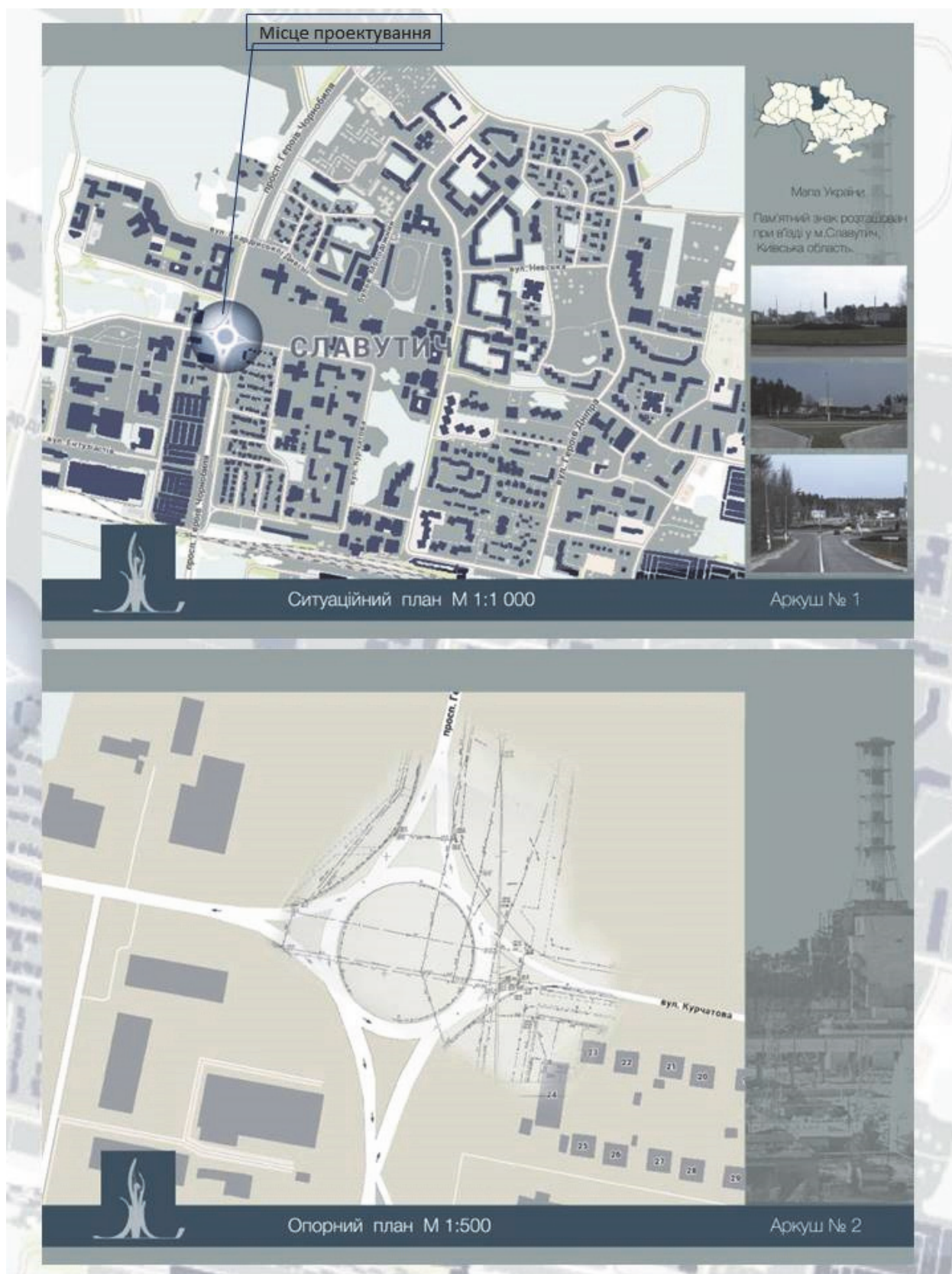
Рис.1 Ситуаційний план міста Славутич. Опорний план місця проектування.