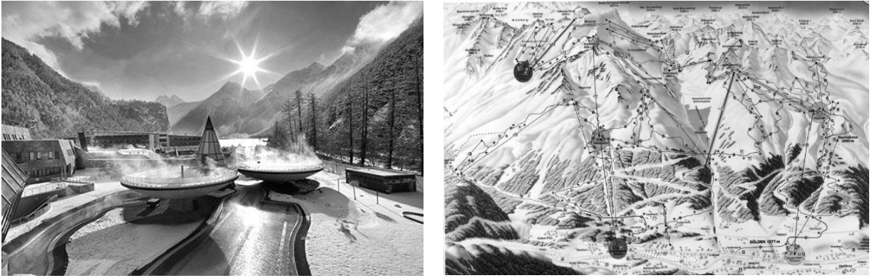
Рис. 4. Гірськолижний комплекс Зельден (Soelden) в Австрії