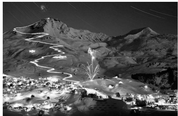
Рис. 3. Гірськолижний курорт Гріндевальд (Grindewald) в Швейцарії