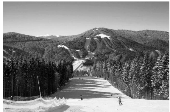
Рис. 2. Гірськолижний курорт Буковель в Україні