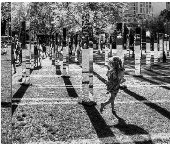
Рис.1 Лабіринт «Задзеркалля, м. Сідней.

Активну участь у процесі взаємодії з середовищем передбачає фізична активація. Коли сценарні варіанти направлені на розвагу користувачів, відбувається відродження традиційних колективних ігор, організовуються простори з незвичайними середовищними умовами, що спонукають людей до фізичної взаємодії. Так, наприклад, в Тель-Авіві сконструювали парк спеціально для дорослих, які хочуть погратися. Це не тренажери для вуличних занять спортом, які зустрічаються часто, тут ізраїльтяни після роботи лазять по Мотузковому містечку [6] (Рис. 2).