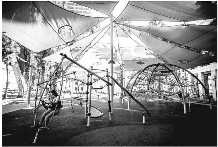
Рис.2 «Мотузкове містечко», м. Тель-Авів.

Простір для візуальної взаємодії та спілкування можливо створити розташуванням обладнання для сидіння по колу, цей простір спонукає для колективної бесіди, обговорення. Також, розміщувати обладнання амфітеатральним способом, таким чином акцентуючі увагу на місце умовної сцени, де лінію спілкування та обговорення проводить ведучий. Підняття або заглиблення обладнання для сидіння на різні рівні створює умови для кращої візуальної взаємодії. Так звана театралізація простору, поява амфітеатральних зон створює можливість для мобільного кінопоказу, організації вистав, до яких можна залучати акторів, організовувати різні зустрічі за інтересамим (Рис. 3).