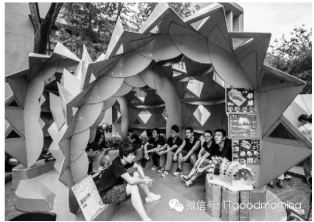
Рис.4 Тематичний парк з картону.

Формування дворових та внутрішньоквартальних культурно-дозвіллевих зон можливо реалізовуватися завдяки засобам трансформації обладнання. Трансформативна зміна архітектурних якостей обладнання створює умови адаптивності простору до потреб, дає можливість зміни та перетворення простору, призначення процесу взаємодії в середовищі, тобто швидко змінювати свої предметно-просторові та функціональні характеристики.